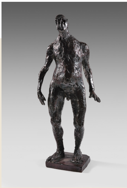
Germaine RICHIER (1902-1959) Homme de la nuit, grand modèle, 1954 Bronze à patine noire Signé et numéroté sur la terrasse «G Richier HC 2», marque du fondeur sur la tranche arrière de la terrasse «Susse Fondeur Paris.» Hauteur: 73 cm Estimation : 200 000 - 300 000 €