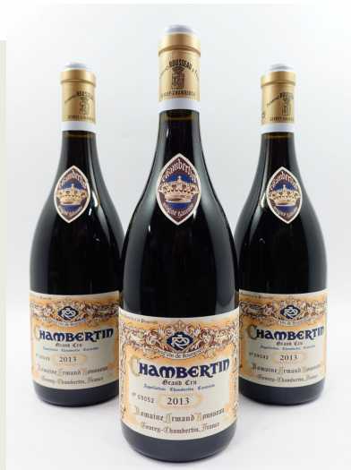
Lot 222 8 bouteilles CHAMBERTIN 2013 Grand Cru. Domaine Armand Rousseau Vendu : 22 940 € / 24 276 $ frais inclus