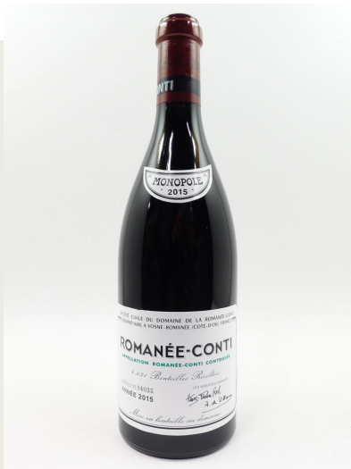
Lot 341 1 bouteille ROMANÉE CONTI 2015 Grand Cru. Domaine de la Romanée Conti Vendu : 31 620 € / 33 462 $ frais inclus

- Stéphane Aubert, Commissaire-priseur & Directeur Associé, Artcurial