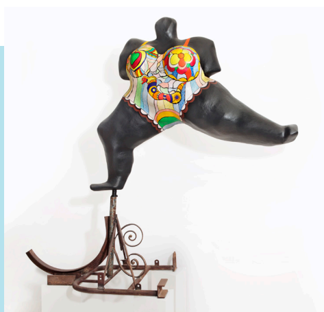
Niki DE SAINT-PHALLE & Jean TINGUELY Polyester et résine peints sur base en acier Vendue 418 000€