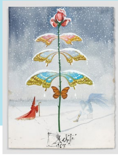
LOT 34: SALVADOR DALÍ Rose et papillons sous la neige (Mariposas) , 1967 Gouache, aquarelle et encre sur papier adjugé 130 000 € / 144 300 $ frais inclus (estimation : 60 000 - 80 000 €)