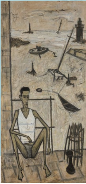
LOT 63: BERNARD BUFFET Homme assis et plage , 1948, Huile sur toile adjugé 443 000 € / 491 730 $ frais inclus (estimation : 350 000 - 450 000 €)