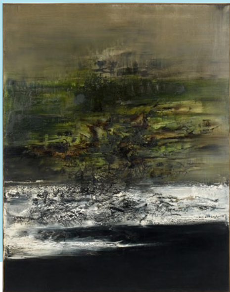
LOT 4: ZAO WOU-KI, 24.1.61/62 - 1961-62 Huile sur toile, adjugé 4 662 600 €/ 5 175 486 $ frais inclus (estimation : 1 500 000 - 2 500 000 €)