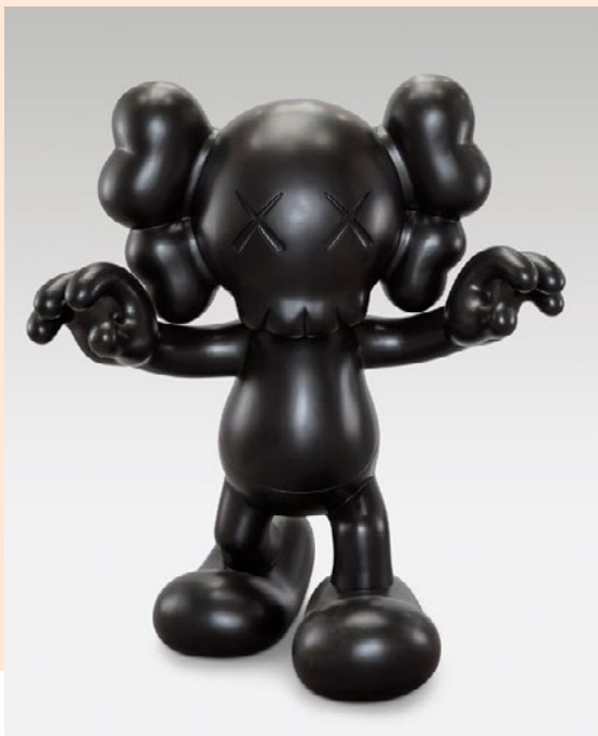
KAWS Final Days , 2014 Bois Estimation : 1 000 000 - 1 500 000 €