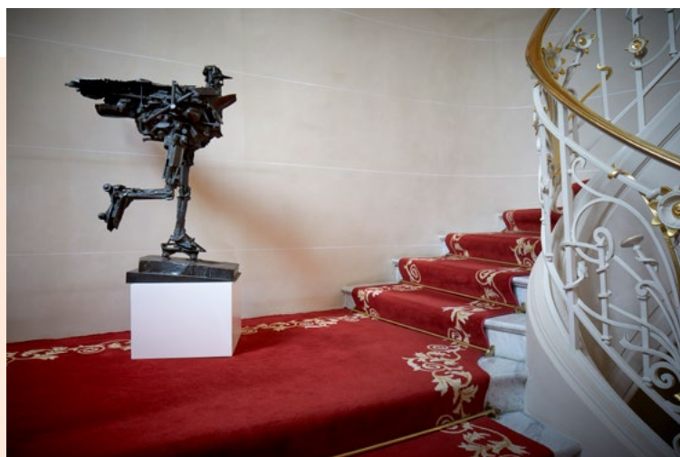
CÉSAR Anna Bronze à patine brune Estimation : 100 000 - 150 000 € Hôtel Hermitage