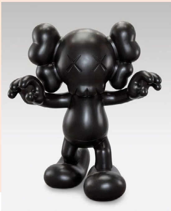
KAWS Final Days , 2014 Bois Estimation : 1 000 000 - 1 200 000 €