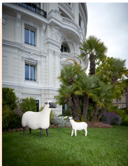
FRANÇOIS-XAVIER LALANNE Brebis et Agneau - 1984 Acier laqué noir Estimations : 100 000 - 150 000 € et 50 000 - 70 000 € Jardins de l'Hôtel de Paris