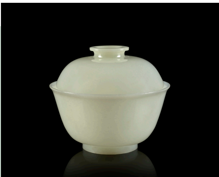
BOL COUVERT EN JADE BLANC, Chine, dynastie Qing, époque Qianlong (1736-1795) Estimation: 12 000 - 18 000 €

Issu de la collection d'un amateur parisien, un vase Hu en porcelaine à glaçure de type guan, daté de la dynastie Qing et d'époque Qianlong est à souligner. Ce vase, de forme hexagonale balustre et recouvert d'une glaçure céladon pâle, est estimé 15 000 - 20 000 €.