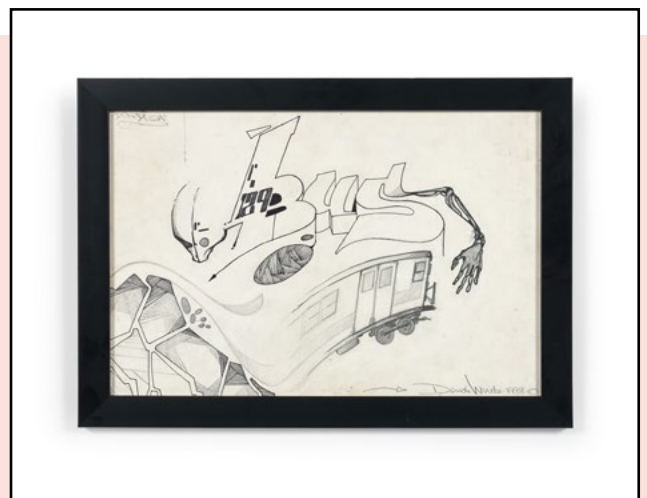
DONDI WHITE (DONALD J. WHITE DIT) Sans titre Crayon sur papier Estimation: 20 000 - 30 000 €