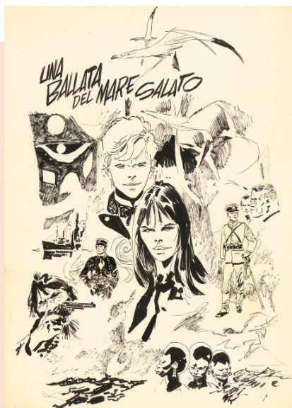
HUGO PRATT Una Ballata del Mare Salato Encre de Chine, feutre, gouache cor- rectrice et collage sur papier pour la couverture de cet album publié en 1972 aux éditions Arnoldo Mondadori editore 49,50 x 36 cm Estimation: 50 000 - 70 000 €