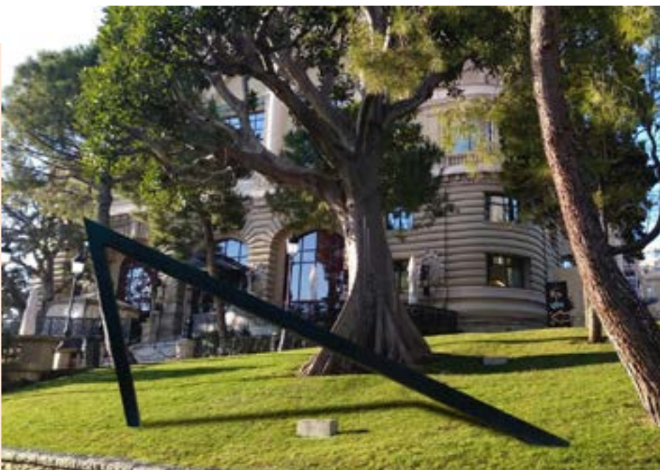
BERNAR VENET 56,5°-Winkel , 1984 Stahl, schwarzlackiert Schätzpreis : 120 000 - 180 000 €