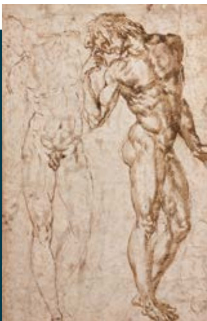
BACCIO BANDINELLI (1493 - 1560) Nus masculins debout (recto et verso) Plume et encre brune Estimation : 30 000 - 40 000 €