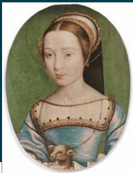
CORNEILLE DE LA HAYE, DIT CORNEILLE DE LYON Portrait d'une dame de la cour de François I er Huile sur panneau de chêne, mis à l'ovale probablement au XIX e siècle Estimation: 150 000 - 200 000 €