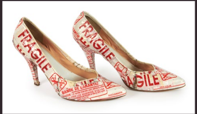
MAISON MARTIN MARGIELA (Printemps-été 2006) Escarpins recouverts d'adhésif « Fragile » appliqué à la main, estimation : 1 200 - 2 200 €