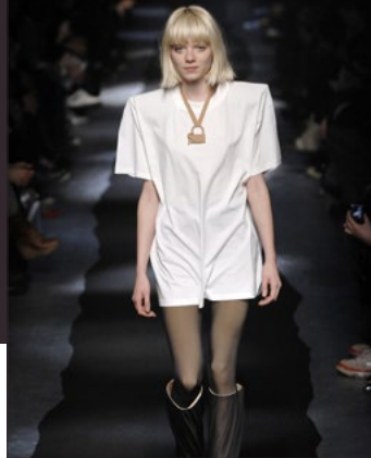
MAISON MARTIN MARGIELA (Automne-hiver 2007/08) Ligne Blanche, Tee-shirt blanc XXL estimation : 500 - 800 €