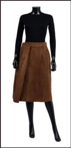
MAISON MARTIN MARGIELA (Automne-hiver 2000/01) Ligne Blanche, Jupe «Taille 78 » en daim marron estimation : 1 000 - 1 500 €