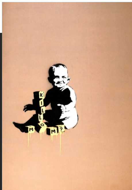
BANKSY Kill Mom ? 2003 Pochoir et peinture aérosol sur carton Pièce unique estimation : 250 000 - 350 000 €