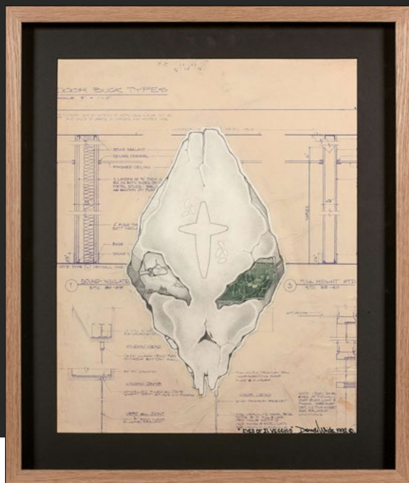
BANKSY Queen Vic , 2004, Sérigraphie sur papier estimation : 3 500 € - 4 000 €