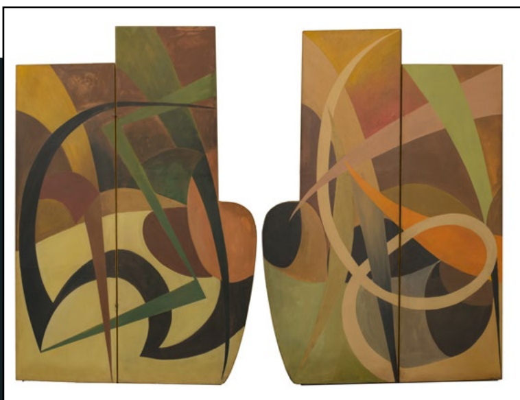
GIACOMO BALLA Linea di velocità (recto), Vortice (verso) , circa 1916-1917 Pravent à deux feuilles à décor double face Peinture à l'eau et crayon sur carton entrecollé sur panneau estimation : 450 000 - 600 000 €

Le sujet-objet, ici une bouteille (illustration même de la société de consommation de masse dans laquelle il évolue) est presque simplifiée à l'extrême. La bouteille reste clairement identifiable mais se confond parfois avec d'autres éléments présents dans l'oeuvre, reconnaissables grâce à l'utilisation de formes colorées. Ces dernières permettent de styliser un écho entre l'arrière-plan du tableau et son sujet principal (estimation : 1M - 1,5M €)