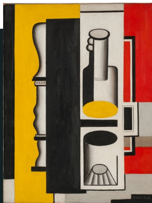
FERNAND LEGER Nature morte à la bouteille , 1927 Huile sur toile estimation : 1M - 1,5M€