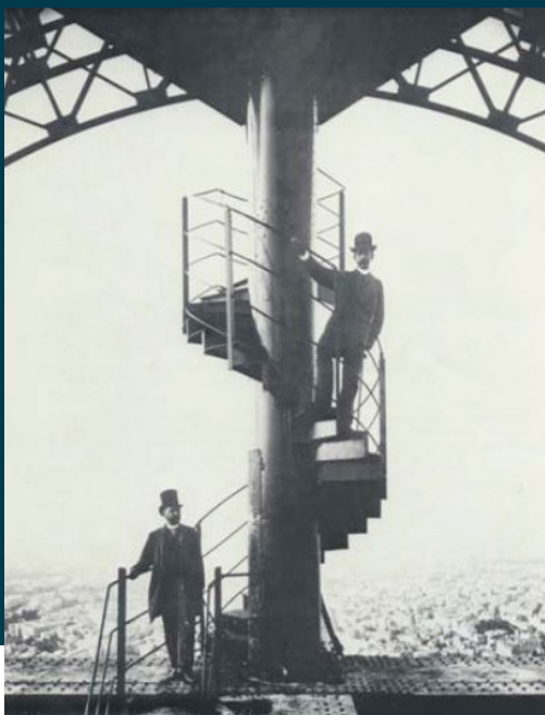
La Tour Eiffel, Exposition Universelle de 1889