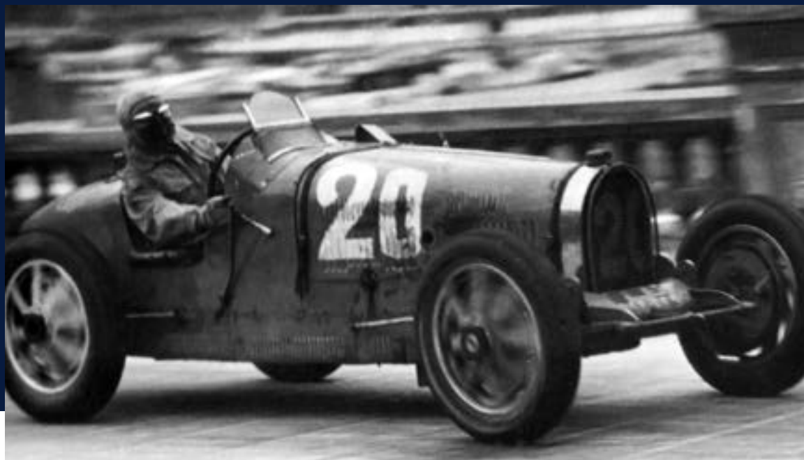
1931 BUGATTI TYPE 51 GRAND PRIX #51128 6e au Grand Prix de Monaco 1936 avec Marcel Lehoux, ex- Trintignant