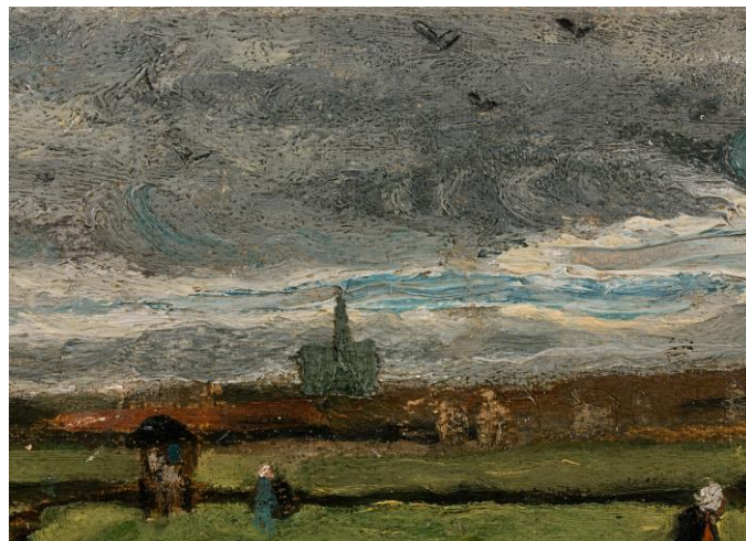
Vincent Van Gogh, Raccommodeuses de filets dans les dunes , Août 1882, détail

En novembre 1881, Van Gogh pose ses valises à La Haye, rempli d'enthousiasme. Il devient, durant trois semaines, l'élève de son cousin par alliance, et surtout remarquable artiste peintre, Anton Mauve (1838-1888). Après des semaines d'intense apprentissage au cours desquelles Van Gogh se révèle en tant qu'artiste, il est contraint de retourner chez ses parents, à Eten, à cause de problèmes financiers. Ce retour se transforme en une visite de courte durée à la suite d'une violente dispute entre Van Gogh et son père, qui le destinait à une vie de pasteur. Cet irréversible différend conduit Vincent Van Gogh à repartir pour La Haye où il se présente à nouveau au