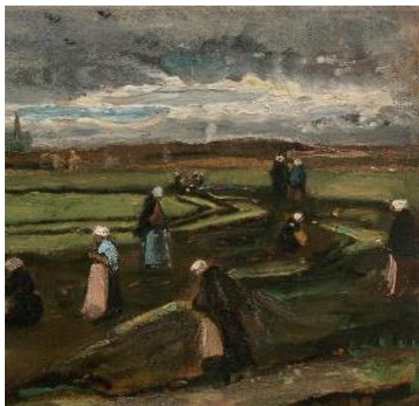
Vincent Van Gogh, Raccommodeuses de filets dans les dunes , Août 1882, détail

Paris – Cela fait plus de 20 ans qu'aucune peinture de Vincent Van Gogh n'a été vendue aux enchères à Paris. Artcurial crée donc l'événement en annonçant que le 4 juin prochain, lors de la grande vente impressionniste et moderne, la maison proposera une huile sur papier du maître néerlandais : Raccommodeuses de filets dans les dunes . Elle était jusque-là exposée sur les cimaises du musée Van Gogh d'Amsterdam, à qui, son propriétaire, un collectionneur privé, l'avait laissée en dépôt depuis 2009.