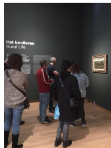
Exposition permanente, Musée Van Gogh, Amsterdam