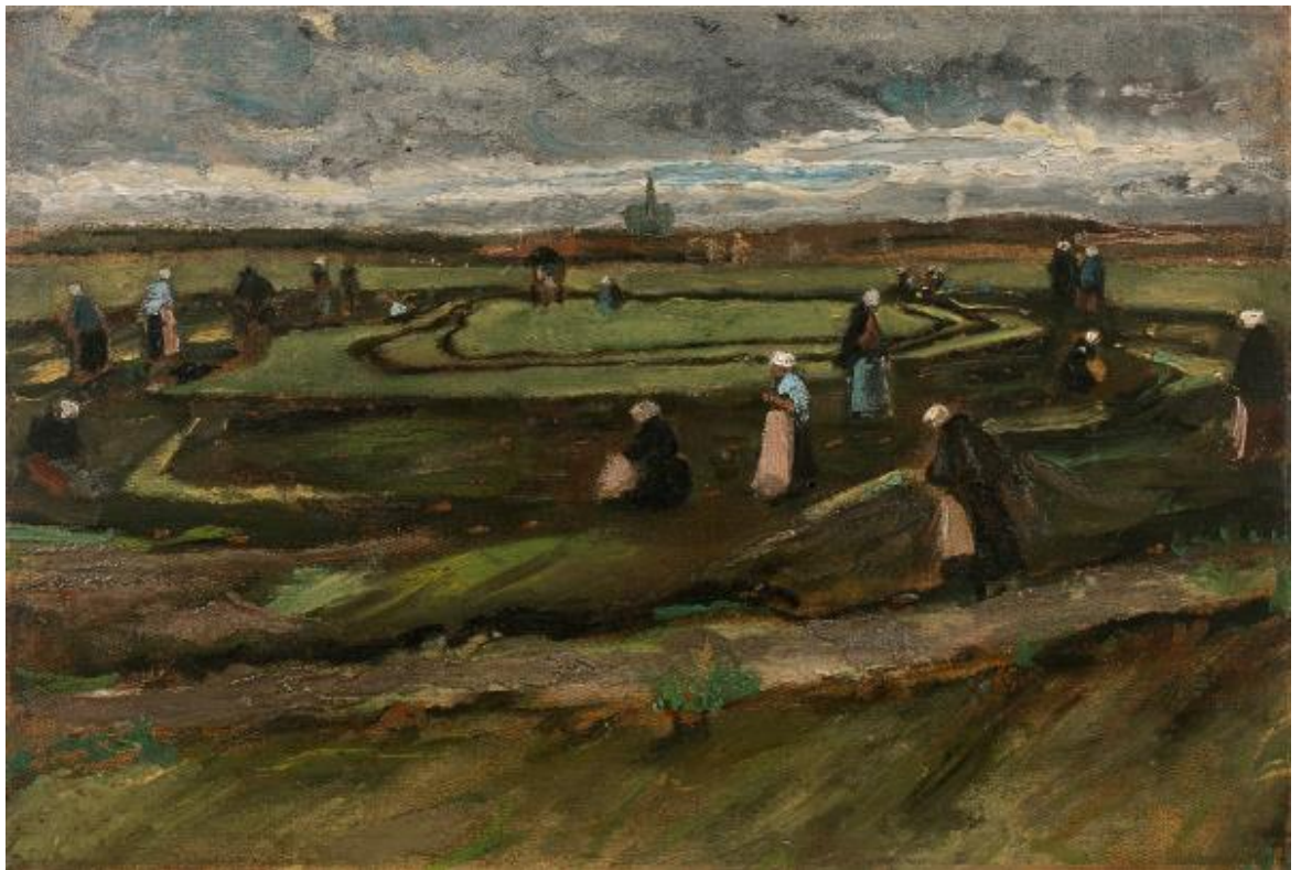
Vincent Van Gogh, Raccommodeuses de filets dans les dunes , Août 1882, Huile sur papier marouflé sur panneau, 42 x 62,50 cm, estimation : 3 000 000 - 5 000 000 € / 3 600 000 - 6 000 000 $