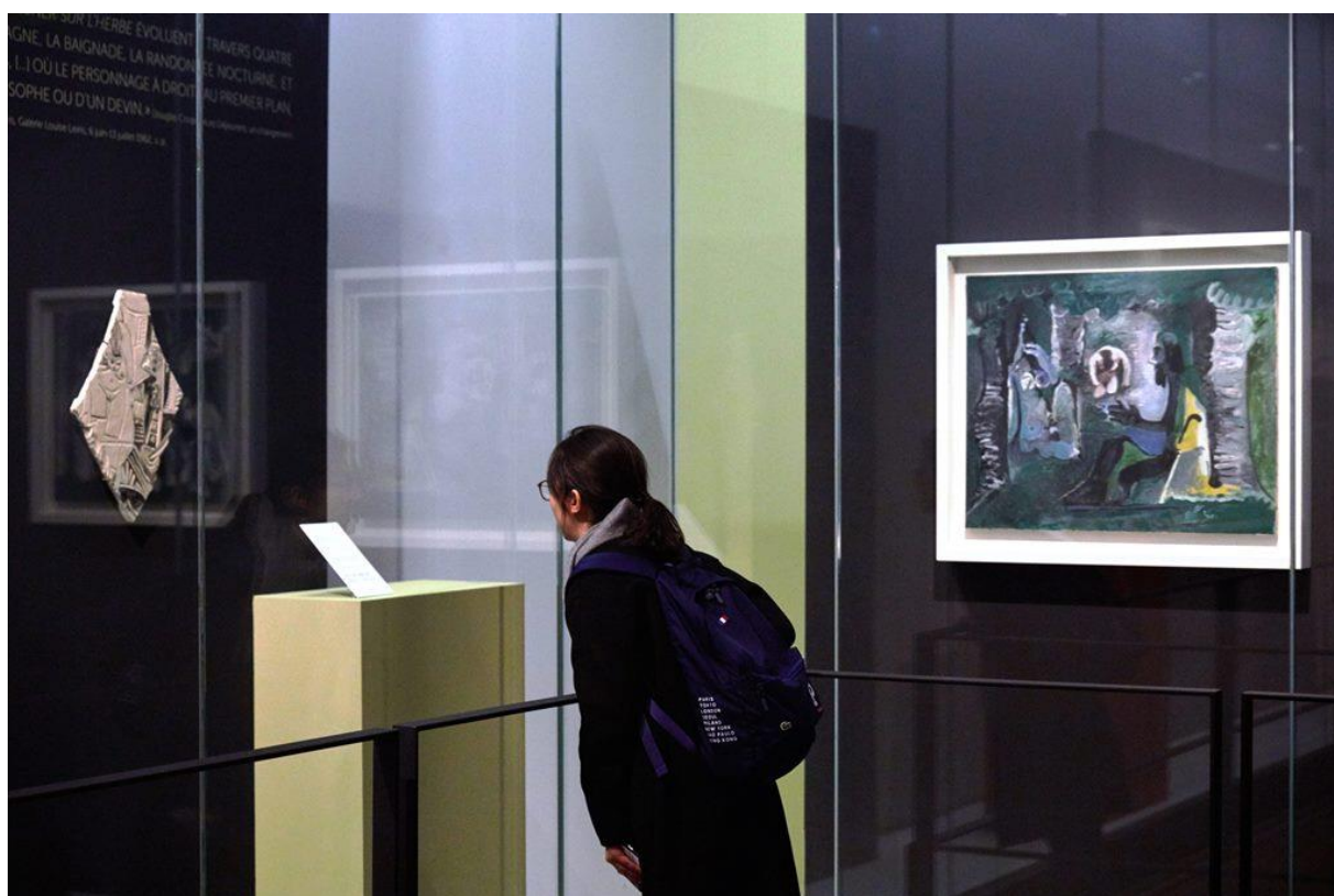
Un voyageur asiatique découvre l'exposition Picasso plein soleil, à l'Espace Musées, dans le Terminal 2E de l'aéroport Paris-Charles de Gaulle

Paris – Le groupe Artcurial apporte son soutien au fonds de dotation Espaces Musées depuis sa création en 2012, à travers un mécénat financier et de compétences. La création de l'agence Artcurial culture, en décembre 2015, a permis de développer encore plus les liens entre les deux structures.