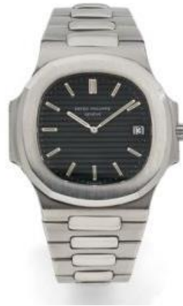
Patek Philippe, Nautilus, ref. 3700/IA, vers 1980, provenant de la collection d'Arman (estimation : 16 000 € - 18 000 € / 17 600 - 19 800 $)

VENTE HORLOGERIE DE COLLECTION LE 17 JUILLET 2017