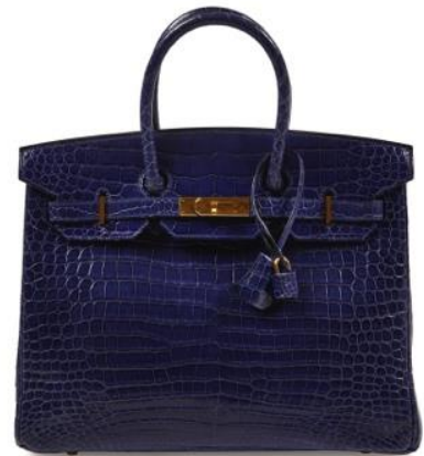
Hermès, Sac Birkin, 35 cm, 1996, Crocodile d'estuaire Bleu Saphir (estimation : 35 000 - 45 000 € / 38 500 - 48 500 $)

VENTE HORLOGERIE DE COLLECTION LE 17 JUILLET 2017