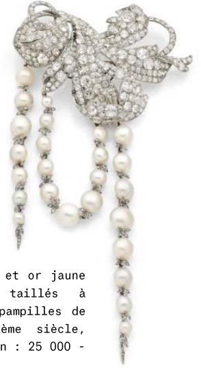
ALTENLOH, Broche en platine et or jaune 18k ornée de diamants taillés à l'ancienne, retenant trois pampilles de perles fines, fin du XIX ème siècle, certificat du LFG (estimation : 25 000 - 35 000€ / 26 177 - 37 204 $)