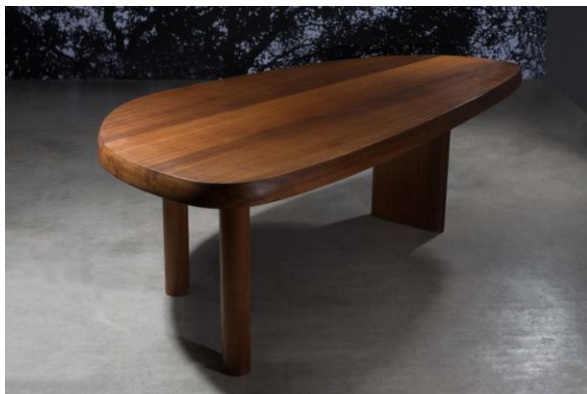
Charlotte Perriand, table Forme libre , création 1958, acajou, Steph Simon éditeur, estimation : 60 000 - 80 000 € / 66 000 - 88 000 $

Artcurial présentera ainsi lors de la vacation un exemplaire de la bibliothèque dite Maison du Mexique , fabriquée en 1952 avec les Ateliers Jean Prouvé (estimation : 80 000 – 120 000 € / 88 000 – 132 000 $).