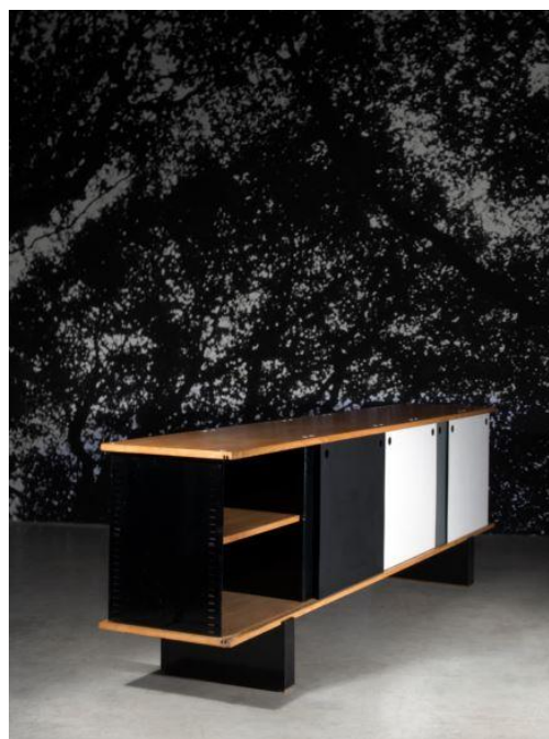
Charlotte Perriand, bahut Cansado , 1959-1963, Steph Simon éditeur, estimation : 35 000 - 45 000 € / 38 500 - 49 500 $

Sportive et amoureuse de la montagne, Charlotte Perriand participe à de nombreux projets dans les Alpes. En 1946-1948, elle travaille à