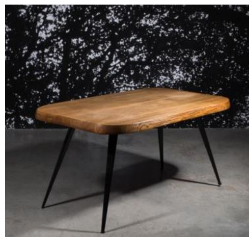
Charlotte Perriand, table 6 couverts, 1958, Steph Simon éditeur, estimation : 20 000 - 30 000 € / 22 000 - 33 000 $