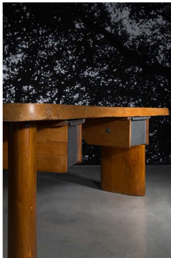
Charlotte Perriand, Important bureau dit « en forme », 1943/1944, structure en pin massif sculpté, tiroir en aluminium, ancien bureau personnel de Pierre Jeanneret, estimation : 300 000 - 400 000 € / 330 000 - 440 000 $