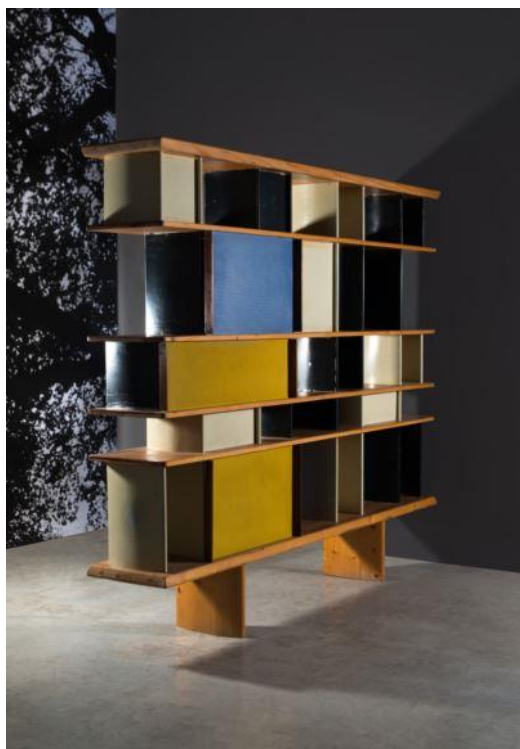
Charlotte Perriand, bibliothèque Maison du Mexique , 1952, acajou, estimation : 80 000 - 120 000 € / 88 000 - 132 000 $