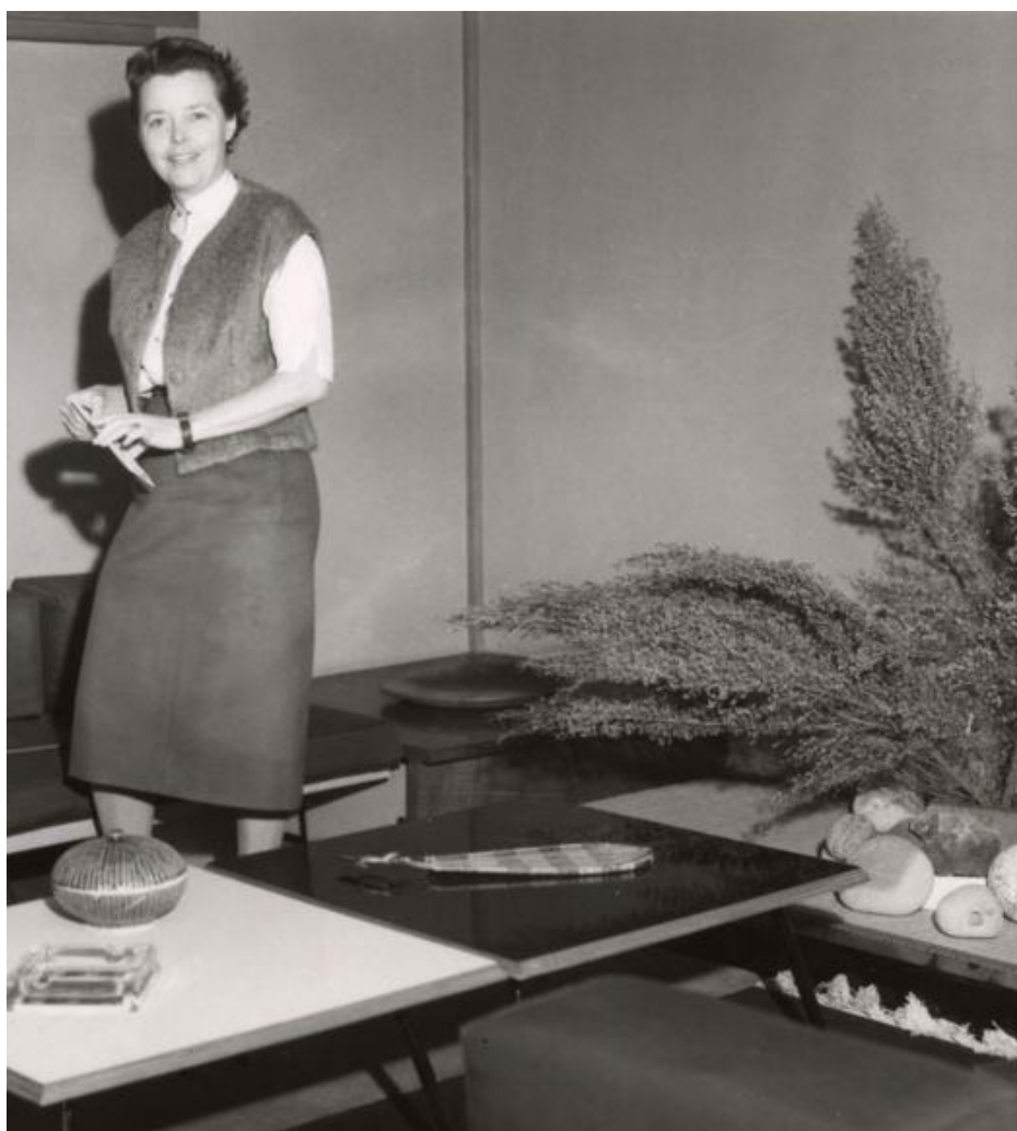
Charlotte Perriand chez elle à Tokyo en 1954