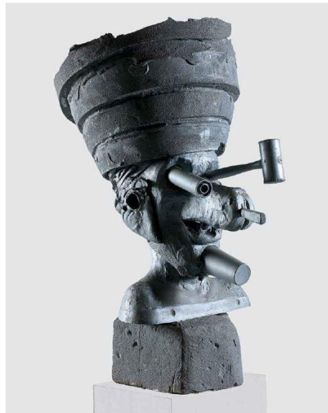
Paul McCarthy, Hammer head , 2004, silicone et caisse en bois d'origine, estimation : 150 000 - 250 000 € / 165 000 - 275 000 $

Parmi les autres courants de la seconde moitié du XXe siècle, citons l'œuvre pop de Raymond Hains, Saffa , datée de 1964, qui offre un bel exemple du Nouveau Réalisme (estimation : 50 000 – 70 000 € / 55 000 – 77 000 $). Par ailleurs, l'art figuratif sera notamment incarné par la réalisation du plasticien américain Paul McCarthy avec sa sculpture en silicone Hammer Head , estimée 150 000 – 250 000 € / 165 000 – 275 000 $.