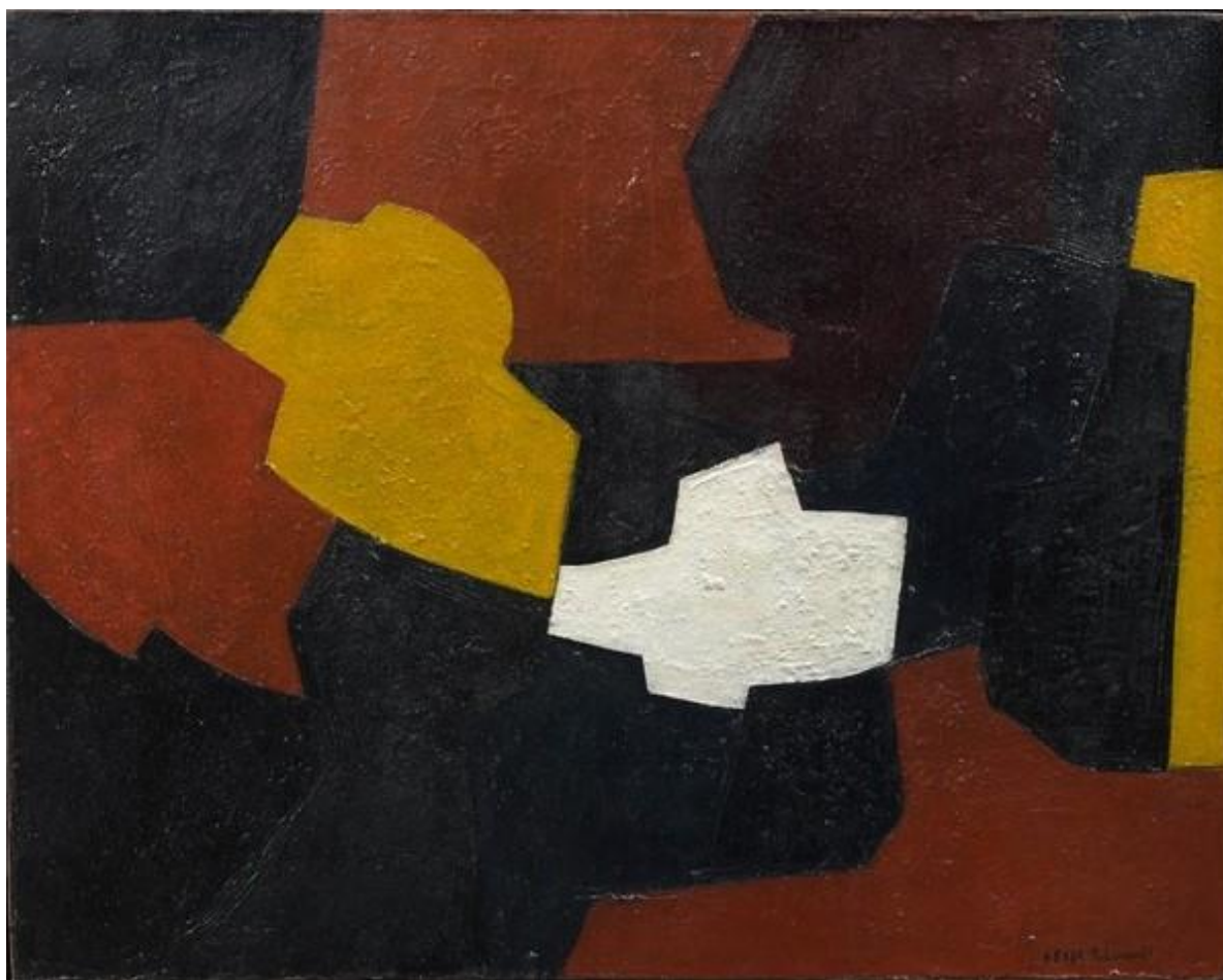
Serge Poliakoff, Composition abstraite , 1950, huile sur toile, estimation : 300 000 - 400 000 € / 330 000 - 440 000 $