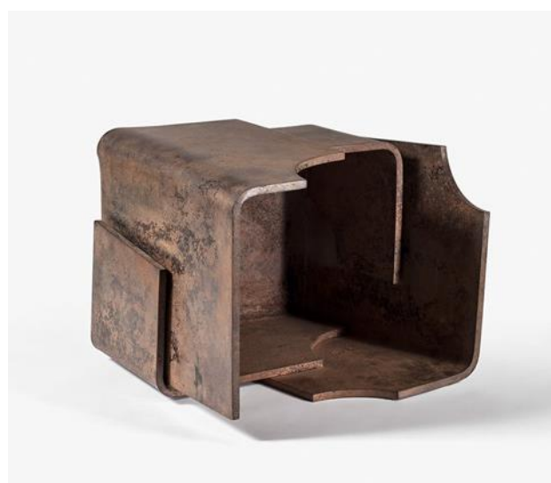
Eduardo Chillida, Locmariaquer VI , 1989, acier, estimation : 300 000 - 400 000 € / 330 000 - 440 000 $

La vente Art Post-War et Contemporain du 31 mai s'inscrit dans le Printemps Paris Tout P'tits chez Artcurial . Plusieurs lots de la vente, signalés dans le catalogue par un petit ourson rose, seront ainsi vendus sans frais au profit de l'association. Paris Tout P'tits est une association loi de 1901 qui subvient aux besoins des bébés de moins de 18 mois, nés dans des familles parisiennes en difficulté.