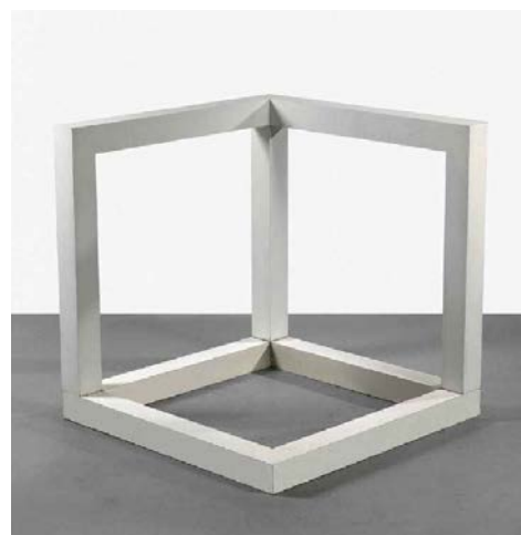
Sol LeWitt, Incomplete Open Cube (Quasi-Cube) 9/1 , 1973, email sur aluminium, estimation : 120 000 - 180 000 € / 132 000 - 198 000 $