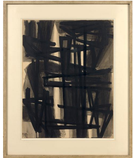
Pierre Soulages, Encre de Chine sur papier , 1949, encre de Chine sur papier, estimation : 120 000 - 180 000 € / 132 000 - 198 000 $

L' Encre de Chine sur papier de Pierre Soulages, réalisée en 1949, est emblématique de ce courant (estimation : 120 000 – 180 000 € / 132 000 – 198 000 $). Persuadé de réaliser un « paysage de neige », l'artiste cherche à créer le contraste pour faire jaillir la couleur. Pour cela, il révèle le blanc grâce au noir, son opposé chromatique. Ce noir est appliqué à l'encre de Chine, technique qu'il utilise avant le brou de noix, pigment naturel à l'extrait d'écorce de noix. L'année 1949 marque les prémices de l'abstraction et de l'avant-gardisme pleinement assumé de Soulages qui déclare à ce titre : « D'ailleurs à part Pollock, personne d'autre ne peignait de toiles abstraites. Rothko lui-même n'a commencé qu'en 1949 ». L'encre de Chine présentée brasse à la fois un questionnement esthétique et technique à l'aune de l'abstraction tout en s'inscrivant dans un contexte historique marqué par une réappropriation politique qui fait de la peinture de Pierre Soulages l'apanage d'un temps nouveau.