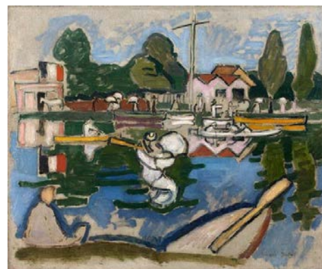
Raoul Dufy, Le Canotage , 1907, huile sur toile, estimation : 600 000 - 800 000 € / 660 000 - 880 000 $