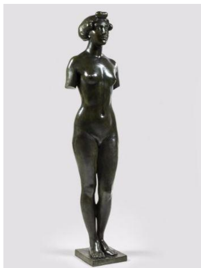
Aristide Maillol, Printemps sans bras , 1911, bronze à patine verte antique, estimation : 350 000 - 450 000 € / 385 000 - 495 000 $

Enfin, un bel ensemble de pièces de mobilier d'Alberto et Diego Giacometti clôturera la vacation du 30 mai à l'image d'une paire de guéridons aux harpies en bronze réalisé par Diego Giacometti et estimée 200 000 – 300 000 € / 220 000 – 330 000 $).