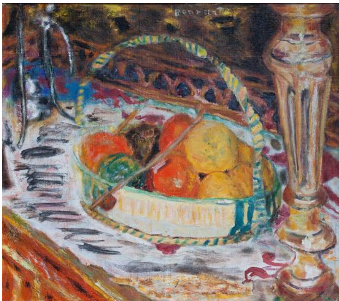
Pierre Bonnard, Corbeille de fruits , huile sur toile, 1924, estimation : 600 000 - 800 000 € / 660 000 - 880 000 $

Ventes les 30 et 31 mai 2017 à 19h et 15h, à Paris