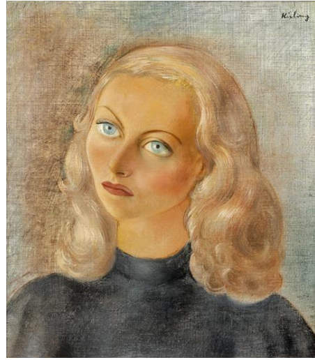
Moïse Kisling, Portrait de Michèle Morgan , 1942, huile sur toile, provenance : succession Michèle Morgan, Paris, estimation : 40 000 – 60 000 € / 44 000 – 66 000 $

Plusieurs maîtres du courant postimpressionniste seront également mis à l'honneur. Parmi eux, Pierre Bonnard avec la Corbeille de fruits réalisée en