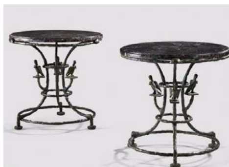
Diego Giacometti, paire de guéridons aux harpies , bronze à patine brun vert, plateau en marbre, estimation : 200 000 - 300 000 € / 220 000 - 330 000 $