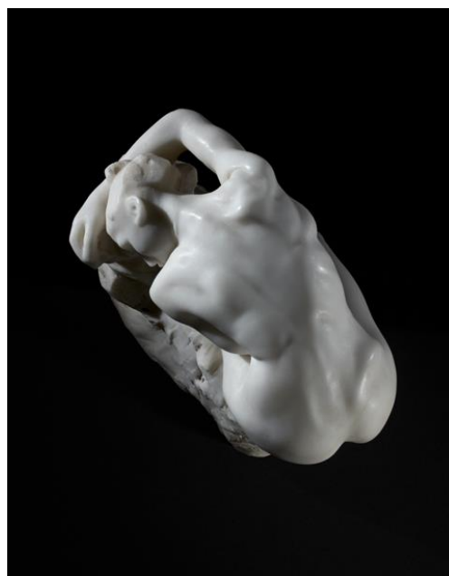
Auguste Rodin, Andromède , 1887, marbre, 28,1 x 30,7 x 18,5 cm, provenant de la famille Lynch de Morla, estimation : 800 000-1 200 000 € / 880 000-1 320 000 $