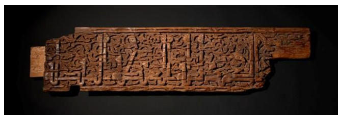
Poutre en bois à inscriptions calligraphiques, Espagne, Art Nasride, 14 e siècle, estimation : 12 000 - 15 000 € / 13 200 - 16 500 $

Le chapitre consacré aux Arts de l'Islam présentera une importante poutre en bois gravée d'inscriptions religieuses en coufique « végétal » parmi des rinceaux feuillagés, encadrées de part et d'autre d'une frise à motifs tressés. Elle est datée du 14 e siècle.