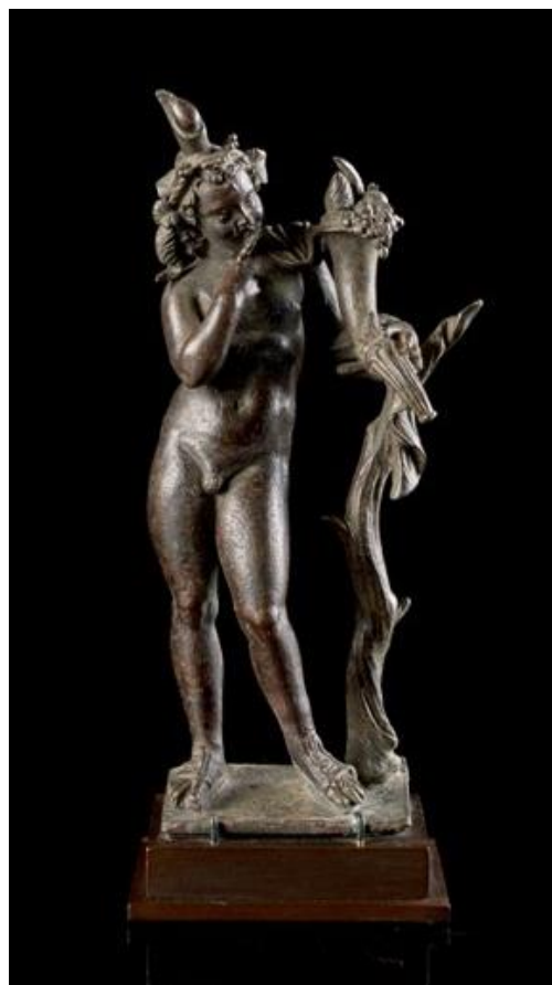
Statuette d'Harpocrate en bronze, Art Egypto-Romain, I er siècle av J.-C., haut. : 13,3 cm, estimation : 50 000 -60 000 € / 55 000 - 60 000 $

Paris – Le 23 mai prochain, Artcurial organisera une vente consacrée aux Arts d'Orient. Comprenant près de 160 pièces, la vacance sera divisée en deux chapitres. Le premier, consacré à l'archéologie, comportera un très bel ensemble d'antiquités classiques et orientales, dont un plat en argent daté du 5 e siècle, d'Art Sassanide représentant une scène de chasse (estimation : 200 000 – 250 000 € / 220 000 – 275 000 $). Le second volet sera dédié aux Arts de l'Islam et de l'Inde avec plusieurs collections de céramiques et bronzes islamiques, mais également de belles pièces Iznik, divers manuscrits et une série de miniatures indiennes.