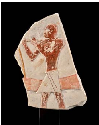
Relief en calcaire, Egypte, époque Saïte, 7 e siècle avant J.-C., pigments rouges, haut. : 22,2 cm, estimation : 14 000 - 18 000 € / 15 400 - 19 800 $

Au chapitre de l'Art Romain, notons également une Tête de Minerve en marbre, daté du IIe siècle (estimation : 40 000 – 50 000 € / 44 000 – 55 000 $). L'Art Cycladique sera quant à lui représenté par une idole dite « Stargazer » en marbre d'Anatolie, datée du 3 e millénaire av. J.-C. De type Kiliya, elle se tient debout, les jambes jointes et les épaules arrondies avec les bras en forme d'ailerons légèrement détachés (estimation : 15 000 – 18 000 € / 16 500 – 19 800 $).