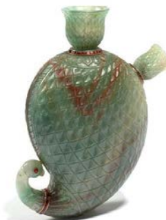
Base de Hookah en jade, Inde Moghole, 19 e siècle, estimation : 10 000 - 12 000 € / 11 000 - 13 200 $