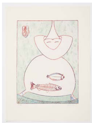
Lot 225 : Pierre HEBEY, Festin , 1974, 12 poèmes illustrés de 12 lithographies originales de Max Ernst, adjugé frais inclus 15 800 € / 17 380 $ (estimation : 2 000 – 3 000 €).

RECORD DU MONDE POUR L'OUVRAGE AUX ENCHERES