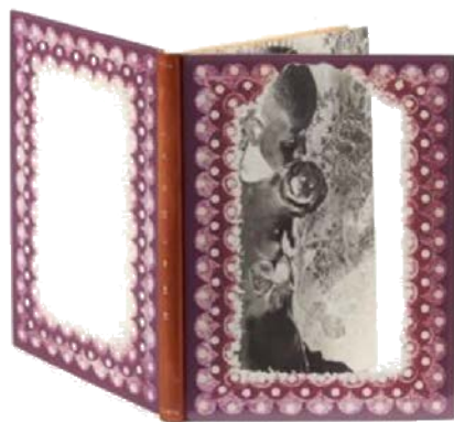
Lot 191 : Hans BELLMER, La Poupée , 1936, édition originale de la version française, adjugé frais inclus 41 500 € / 45 650 $ (estimation : 10 000 – 15 000 €).