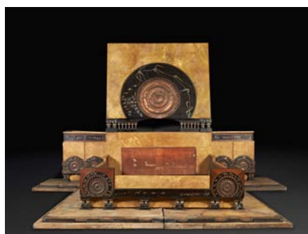
Lot 525 : Carlo BUGATTI, Lit d'apparat , circa 1902, adjugé frais inclus 73 700 € / 81 070 $ (estimation : 10 000 – 12 000 €).