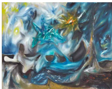
Lot 11 : Roberto MATTA, Morphologie psychologique de l'angoisse , 1938, huile sur toile, adjugé frais inclus 845 000 € / 929 500 $ (estimation : 700 000 – 900 000 €).