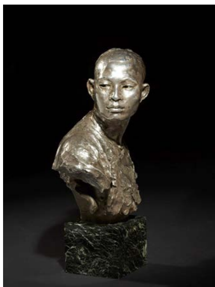
Lot 415 : Jean-Baptiste CARPEAUX, Le chinois (esquisse) , bronze à patine argentée, adjugé frais inclus 70 000 € / 77 000 $ (estimation : 8 000 – 12 000 €).

A 14h, mardi 23 février 2016, Matthieu Fournier, commissaire-priseur et directeur associé d'Artcurial, a donné le coup d'envoi de la vacation dédiée à l'impressionnante collection de près de 200 bronzes français du XIXe siècle de Pierre Hebey. Au terme d'une vente fleuve de 4h, marquée par les nombreuses batailles entre les enchérisseurs en salle, au téléphone ou sur Internet, cette 3 ème partie totalise 2 331 985 € / 2 565 183 $, dépassant une nouvelle fois l'estimation globale, avec 89 % de lots vendus.