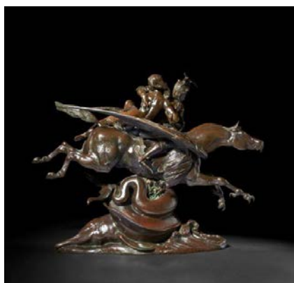
Lot 317 : Antoine-Louis BARYE, Angélique et Roger montés sur l'hippogriffe , circa 1860, bronze à patine brun rouge, adjugé frais inclus 237 400 € / 261 140 $ (estimation : 80 000 – 120 000 €).