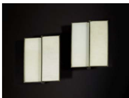
Lot 596 : Jean-Michel FRANCK, Paire d'appliques , circa 1927, adjugé frais inclus 63 800 € / 70 180 $ (estimation : 4 000 – 6 000 €).

C'est à 19h, le mardi 23 février 2016, que Francis Briest, commissaire-priseur et Président du conseil de surveillance et stratégie d'Artcurial, a débuté la dernière vacation de la vente « Le regard de Pierre Hebey, Les passions modérées ». Elle était dédiée à l'Art déco. Cet ultime chapitre a totalisé 881 741 € / 969 915 $, avec 76 % de lots vendus.