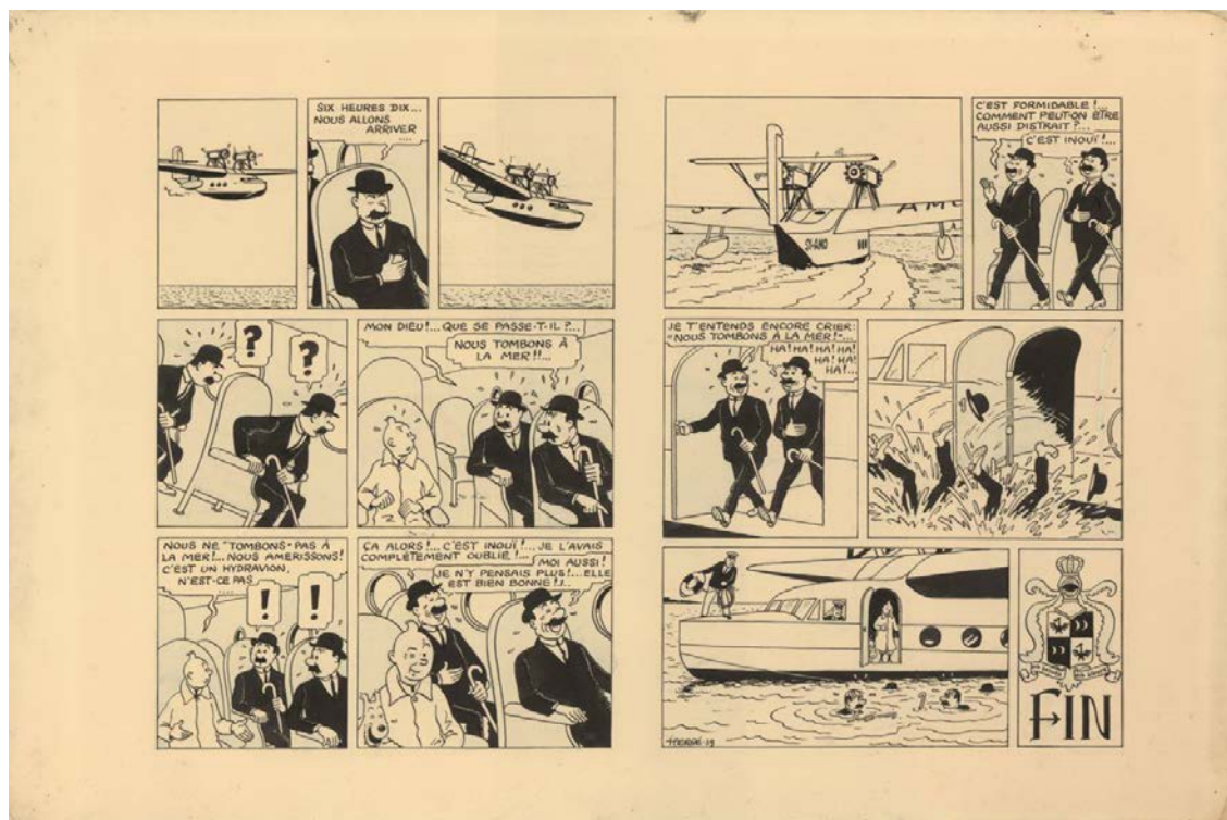
Lot 157 : HERGÉ (Georges Remi dit), Le Sceptre d'Ottokar, aquarelle et encre de Chine, pour la double planche de fin de l'album publié en 1939 aux éditions Casterman, 39,5 x 60 cm, Collection Renaud, adjugé 1 046 300 € / 1 192 782 $ frais inclus (estimation : 600 000 - 800 000 € / 650 000 - 865 000 $)

Résultats de la vente du 30 avril 2016, à Paris