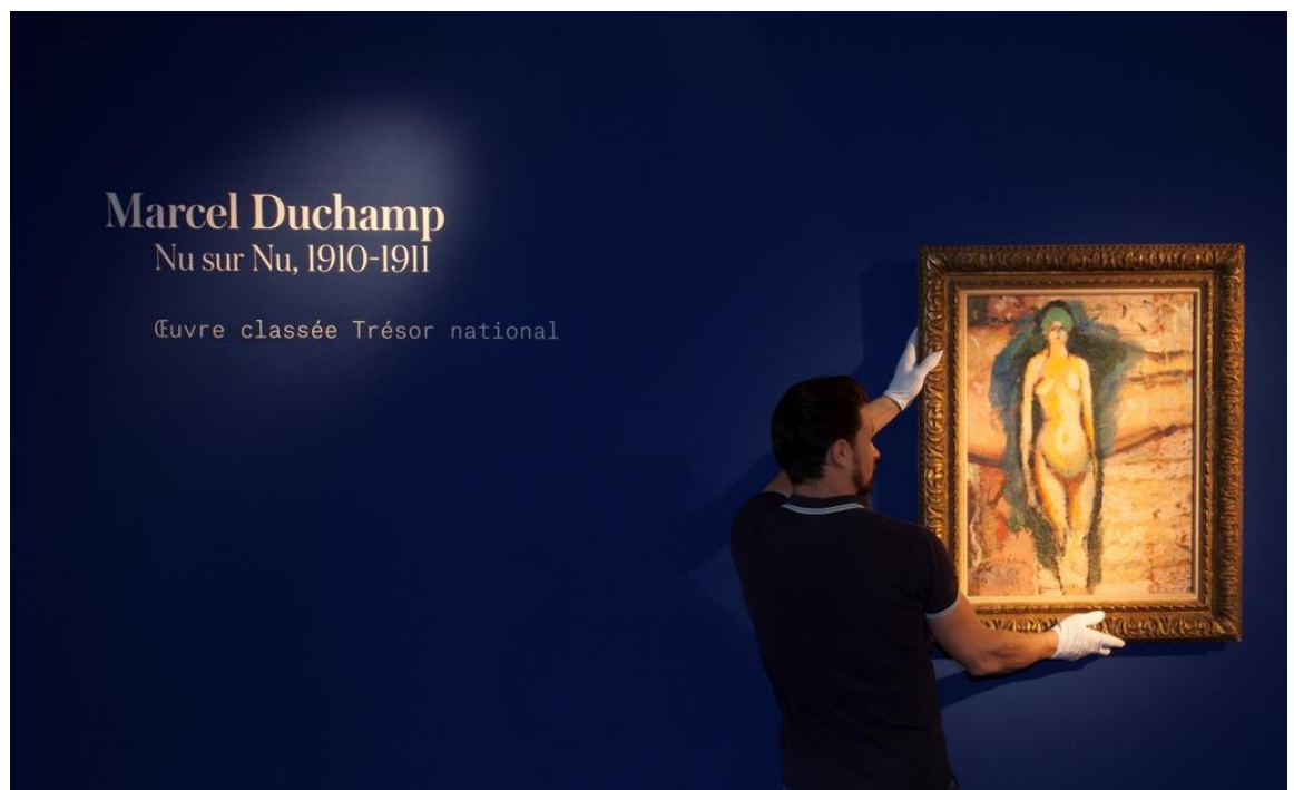
Marcel Duchamp, Nu sur nu , 1910-1911, huile sur panneau, 65 x 51 cm, Trésor National, adjugé 1 243 000 € / 1 417 020 $ frais inclus (estimation : 500 000 - 700 000 € / 555 000 - 775 000 $) RECORD DU MONDE AUX ENCHERES POUR UNE PEINTURE DE L'ARTISTE

Résultats de la vente du 6 & 7 juin 2016, à Paris