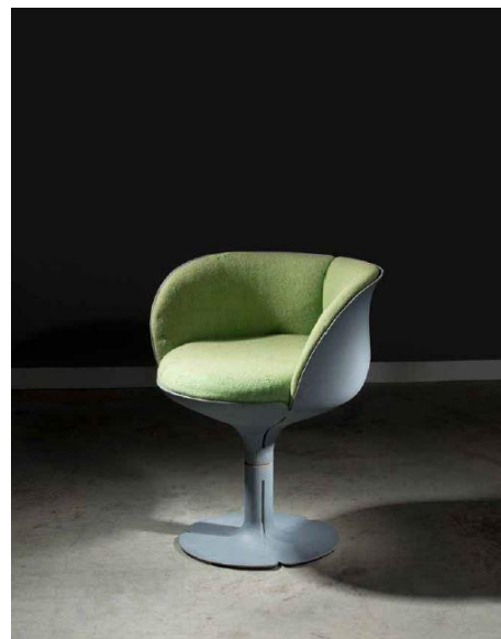
Lot 188 : Pierre Paulin, rare fauteuil dit Elysée , 1973, adjugé frais inclus 16 900 € / 18 928 $ (estimation : 5 000 – 8 000 € / 5 500 – 8 800 $)

Enfin, le Design contemporain s'est illustré par le prix obtenu pour l'unique prototype de la bibliothèque Restless , 2007 (lot 179), vendu 266 500 € / 298 480 $, dont Artcurial a vendu un des six exemplaires existant en 2014, record du monde pour une pièce du designer aux enchères ; mais également les 16 900 € / 18 928 $ pour un rare fauteuil Elysée (lot 198) de Pierre Paulin, estimé 5 000 – 8 000 €.