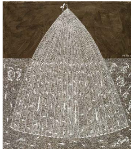
Jivya Soma Mashe, Fishnet , 2015, acrylique et bouse de vache sur toile, 157 x 144 cm