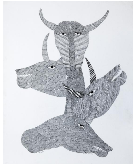
Jangarh Singh Shyam, 1999, encre sur papier, 70 x 56 cm