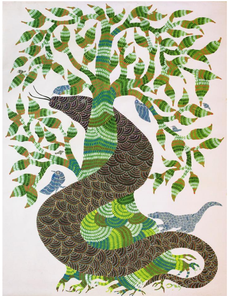
Jangarh Singh Shyam, 1990, acrylique sur papier, 215,5 x 152,5 cm

Exposition du 23 juin au 28 août 2016, à Paris