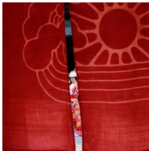
Marion Dubier-Clark, Japanese lady , Nara 2016, Tirage argentique 60 x 60 cm, numérotée sur 8, signé par l'auteur, 800 €

Formée à l'école de photographie EFET, Marion Dubier-Clark se perfectionne dans l'art du portrait et du paysage à travers divers voyages notamment aux États-Unis. On peut retrouver ses tirages dans des collections particulières mais aussi dans le fonds photo de la BNF. La photographe expose dans plusieurs galeries à Paris où Tokyo et collabore avec divers magazines. En 2009, elle édite elle-même et distribue un premier livre intitulé 100 Polaroids . Après le succès de cette première expérience, elle auto-édite à nouveau en 2011 : Polaroids / From New York to New Orleans et en 2012 From San Francisco to Los Angeles en 2015 From Florida to Cuba aux éditions Filigranes et L'heure dite présentant ses impressions de voyage à travers les USA. En 2014, elle devient ambassadrice Fujifilm pour la série X. Pour son exposition chez Artcurial, elle a choisi une sélection de photographies consacrées au Japon où l'on retrouve sa touche distanciée et lumineuse.