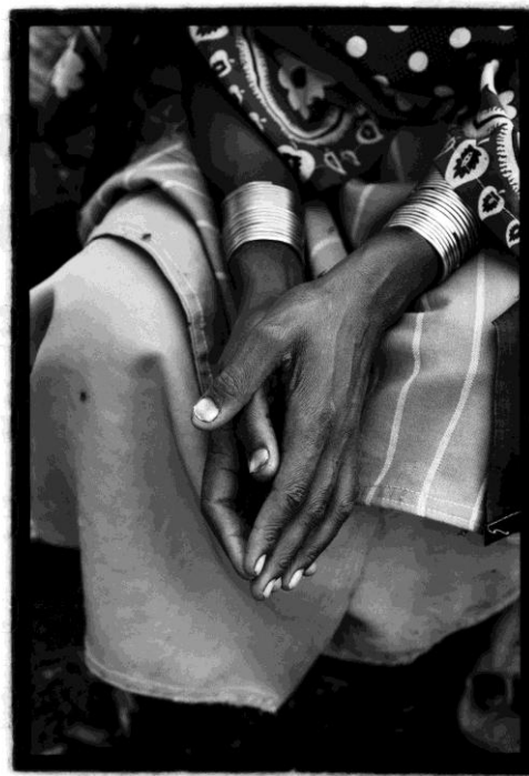
Anne de Vandière, Au pied du Kilimanjaro, les mains d'une femme Masai , Tanzanie, 2011, 1/5, 60 X 50 cm, 3 000 €

Pour Artcurial, elle a sélectionné des photographies de personnages exclusivement féminins. Le titre de cette exposition Terre-Mères est un hommage aux femmes des TRIBU/S DU MONDE .