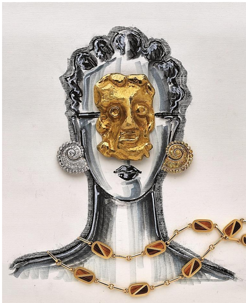
Elie Top, 2016, pour Artcurial

Ventes du 16 au 21 juillet 2016, à Monaco