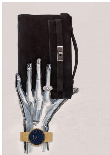
Elie Top, 2016, pour Artcurial