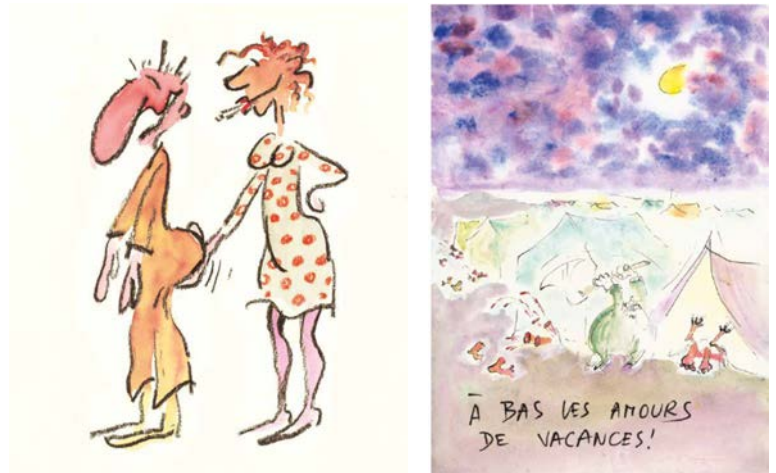
REISER : Vive les femmes ! , crayon et aquarelle sur papier pour la couverture de cet album (Éditions du Square, 1978). Estimation : 3 000 – 5 000 € / 3 350 – 5 590 $. A bas les amours de vacances! Encre de Chine et aquarelle pour une illustration (Édition du Square, 1980), 2 000 – 3 000 € / 2 200 – 3 400 $

Fondateur du journal satirique Hara Kiri aux côtés de Cavanna et Fred, Reiser participera également à l'aventure de pilote et Charlie Hebdo où il croque le français moyen dans un style cru et direct.