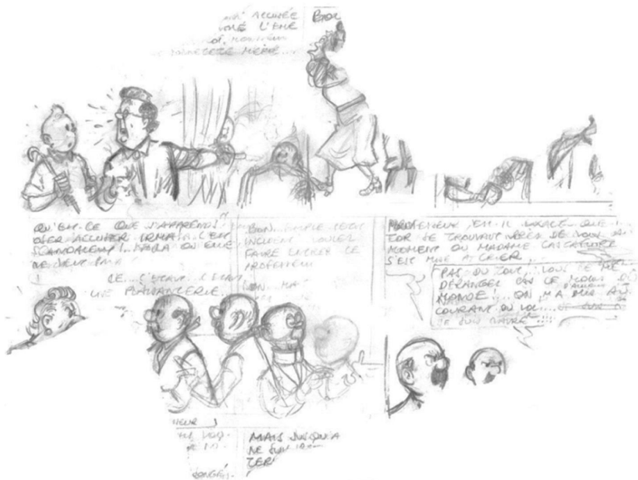
HERGÉ (Georges Remi dit) : Les Bijoux de la Castafiore , crayon sur papier pour deux strips parcellaires de cet album (Casterman, 1963). Estimation : 8 000 – 12 000 € / 8 940 – 13 410 $)