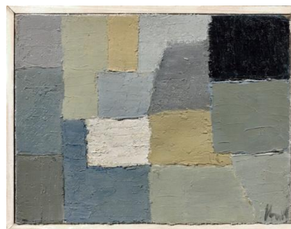
Nicolas de Staël, Composition , 1950, huile sur toile, collection Jean Leymarie, estimation : 200 000-300 000 € / 220 000 - 330 000 $