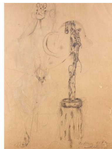
Antonin Artaud, La Balayette , 1946, crayon sur papier, collection Jean Leymarie, estimation : 80 000-120 000 € / 88 000 - 132 000 $