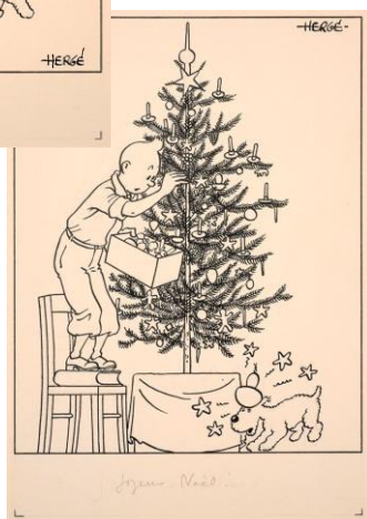
Hergé (Georges Rémi dit), Carte neige, encre de Chine et aquarelle sur papier, 1942/1943, dessin original et édition imprimée, estimation: 60 000 - 120 000 € / 66 000 - 132 000 $