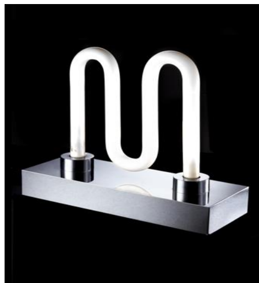
Ingo Maurer, Lampe à poser dite « Big M », circa 1970, base en laiton acier chromé, néon, estimation : 4 000 – 6 000 € / 4 400 – 6 600 $.

Autre rare modèle, celui de la lampe à poser dite Big M d'Ingo Maurer, de 1970 (estimation : 4 000 – 6 000 € / 4 400 – 6 600 $). Composée d'une base en laiton et acier chromé, il s'agit de l'une de ses toutes premières lampes mettant véritablement en scène la matière éclairante, à savoir le néon Philips, en forme de M. Provenant du stock d'une boutique, elle est vendue avec un carton d'ampoules de rechange, aujourd'hui introuvables, car plus fabriquées par Philips. Ce « M » comme métal, mais aussi comme Maurer, est une vraie rareté proposée aux collectionneurs.