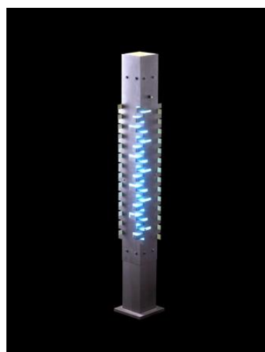
Serge Mouille, exceptionnel luminaire dit « Gratte-ciel », 1962, socle raboté gros grain, structure en acier, estimation : 200 000 – 300 000 € / 220 000 – 330 000 $.