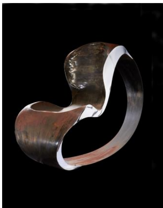
Ron Arad, Fauteuil dit Sit , estimation : 35 000 – 45 000 € / 38 500 – 49 500 $.

Pour ce dernier, il puise son inspiration dans l'« Art Déco » français en transformant le célèbre Chiffonnier anthropomorphe qu'André Groult conçut en 1925. Initialement réalisé comme la pièce maîtresse d'une « Chambre de Madame », délicatement gainé de parchemin, sous la main de Marc Newson, il se pare de plaques d'aluminium aéronautiques rivetées. Aux courbes répondent l'alignement géométrique des rivets.