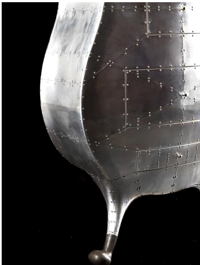
Marc Newson, Chiffonnier dit « Pod of drawers » , 1987, plaques en aluminium « aéronautique » rivetées, estimation : 600 000 - 700 000 € / 660 000 - 770 000 $