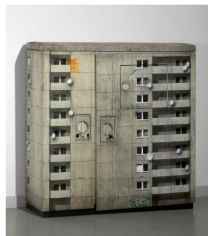
B2 , 2010, EVOL, pochoir et peinture aérosol sur armoire électrique de Anvers (estimation : 15 000 – 20 000 € / 16 300 – 21 700 $)

Parmi les artistes proposés, EVOL, ce jeune talent anonyme du Street Art issu de la scène artistique urbaine berlinoise s'inspire de l'art soviétique. Il reproduit les immeubles populaires de Berlin à partir de cartons récupérés et de mobiliers urbains, tels que des compteurs électriques. Durant cette vacation plusieurs œuvres sont proposées comme cette armoire électrique de Anvers de 2010, B2 (estimation : 15 000 – 20 000 € / 16 300 – 21 700 $) ou encore Dieffenbachstrasse de 2008 peint sur un carton de récupération (estimation : 15 000 – 20 000 € / 16 300 – 21 700 $).