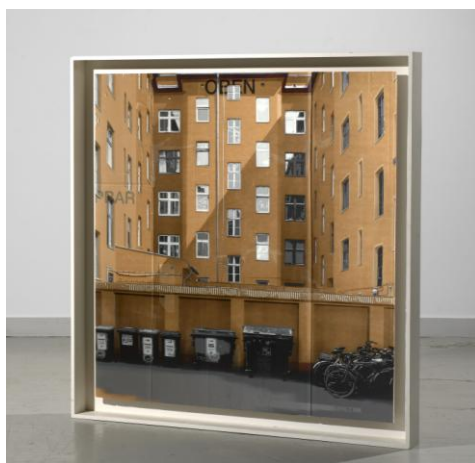
Dieffenbachstrasse , 2008, EVOL, pochoir et peinture aérosol sur carton de récupération (estimation : 15 000 – 20 000 € / 16 300 – 21 700 $)