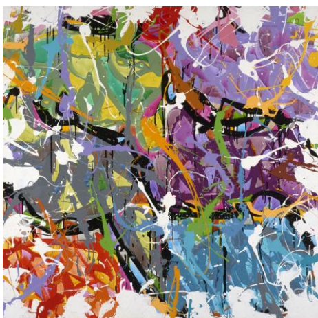
Pick & Mix , 2013, JONONE, acrylique sur toile, 110 x 110 cm (estimation : 13 000 – 18 000 € / 13 975 – 19 350 $)

En 2015, Artcurial a confirmé sa place de leader sur le marché du Street Art et plus particulièrement celui du graffiti historique. La maison de vente a notamment remporté le record mondial pour une œuvre de Dondy White aux enchères. La vacation du 14 février comprendra des œuvres emblématiques des artistes américains du début du mouvement, mais également d'artistes des scènes urbaines contemporaines reconnus sur le marché comme JonOne dont Pick & Mix de 2013 (estimation 13 000 – 18 000 € / 13 975 – 19 350 $) ou encore Almighty One (estimation 25 000 – 35 000 / 27 080 – 37 910 $) de 1993. JonOne fait parti des graffeurs qui ont commencés par taguer les trains de New-York et aujourd'hui s'exprime avec autant d'intensité sur des toiles. Cet autodidacte est l'un des pionniers et une figure incontournable du mouvement Street Art.