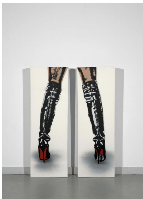
Vandal vs Louboutin , 2015, Nick WALKER, Pochoir et peinture aérosol sur toiles, diptyque 120 x 39,5 cm (estimation : 8 000 – 12 000 € / 8 692 – 13 040 $)

Parmi les artistes proposés, EVOL, ce jeune talent anonyme du Street Art issu de la scène artistique urbaine berlinoise s'inspire de l'art soviétique. Il reproduit les immeubles populaires de Berlin à partir de cartons récupérés et de mobiliers urbains, tels que des compteurs électriques. Durant cette vacation plusieurs œuvres sont proposées comme cette armoire électrique de Anvers de 2010, B2 (estimation : 15 000 – 20 000 € / 16 300 – 21 700 $) ou encore Dieffenbachstrasse de 2008 peint sur un carton de récupération (estimation : 15 000 – 20 000 € / 16 300 – 21 700 $).