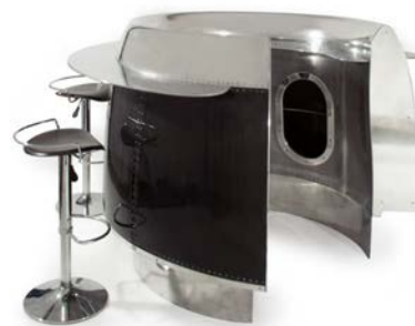
Lot 131, François RALLET, Bar , 128, 5 x 198 x 180 cm, réalisé à partir d'une entrée d'air d'un réacteur Pratt & Whitney JT8D pour Douglas MD-80 (estimation : 6 000 – 9 000 € / 6 760 – 10 135 $)