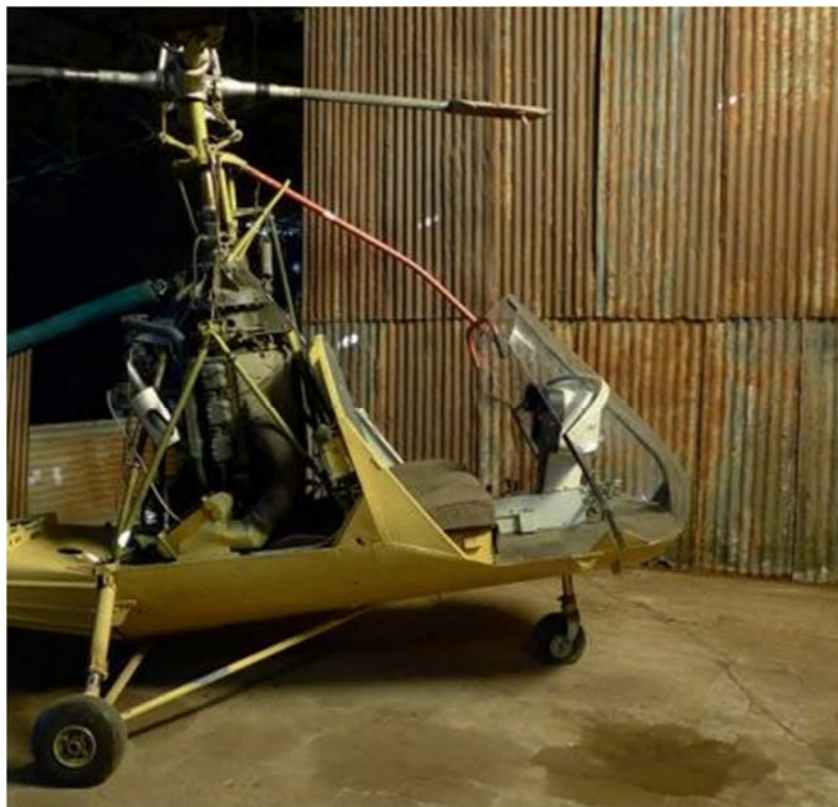
Lot 154, HILLER UH 12A- #274, United Helicopters, 1951, 2,90 m x 11,45 m x 3,20 m. Provenant de l'ancienne collection Marcel Poirée (estimation: 10 000 – 15 000 € / 11 265 – 16 900 $)