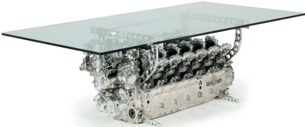
Lot 167, Jean-Pierre Carpentier, Important table bureau, Flamant , réalisé à partir d'un moteur 12 cylindres développé pour Dassault, fin des années 40 (estimation : 30 000 – 40 000 € / 33 600 – 44 800 $) CENTENAIRE DASSAULT AVIATION

Cette année, une série de manifestations célèbrent ce centenaire. Artcurial s'y associe en réunissant 80 lots liés à l'histoire de l'entreprise : maquettes, photographies, instruments de bord, pièces de mobilier aéronautique réalisées à partir d'éléments des avions emblématiques de Dassault Aviation. On trouvera notamment deux maquettes de Falcon 8X customisées par les artistes Zenoy et Enki Bilal (lots 229 et 230, estimés 500 – 800 € / 565 – 900 $) qui seront vendus au profit de l'association Sport dans la Ville.