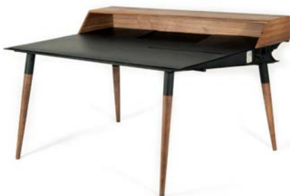
Lot 125, Odile NINET, Bureau McDonnell Douglas F-4 Phantom II , 92 x 150 cm (estimation : 6 000 – 9 000 € / 6 760 – 10 135 $)

Développé aux Etats-Unis à partir de 1947 par la firme United Helicopters, le Hiller 360 connaîtra plusieurs évolutions et sera produit jusqu'en 1965 à plus de 2 000 exemplaires. C'est l'un des tout premiers hélicoptères fabriqués en série au monde. Utilisé par les Américains pendant la guerre de Corée, le Hiller est le premier hélicoptère mis en œuvre par l'armée française en Indochine en 1950. Initialement servi par les équipages de l'Armée de l'Air, le Hiller s'illustra particulièrement grâce au médecin-capitaine Valérie André, première femme militaire pilote d'hélicoptère. À partir de 1954, une partie des Hiller sera transférée dans l'ALAT (Aviation Légère de l'Armée de Terre) basée à Dax. L'exemplaire proposé aux enchères provient de la collection de Marcel Poirée, un ancien résistant, engagé en 1944 dans les forces américaines dans la cavalerie blindée du général Patton. Passionné d'aéronautique, il en fait l'acquisition dans les années 60.