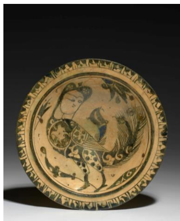
Plat à la harpie, Art Ayyoubide, début du XIII e siècle, estimation : 20 000 - 25 000 € / 22 000 - 27 500 $

Cette miniature indienne représente sur la terrasse d'un palais, une jeune femme se retournant vers son amant qu'elle quitte avec tristesse. Il est étendu sur un lit et tente de la retenir par en attrapant un pan de son voile. Cette scène à l'iconographie traditionnelle, se trouve dans un entourage ovale, encadrée par des écoinçons à décor floral polychrome.