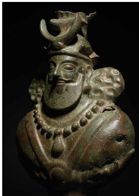
Buste royal, art sassanide, vers le V e siècle, bronze, h. 29,8 cm, estimation : 200 000 - 250 000 € / 220 000 - 275 000 $