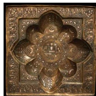
Plateau, Iran, XIII e siècle, cuivre incrusté d'argent, estimation : 20 000 - 25 000 € / 22 000 - 27 500 $