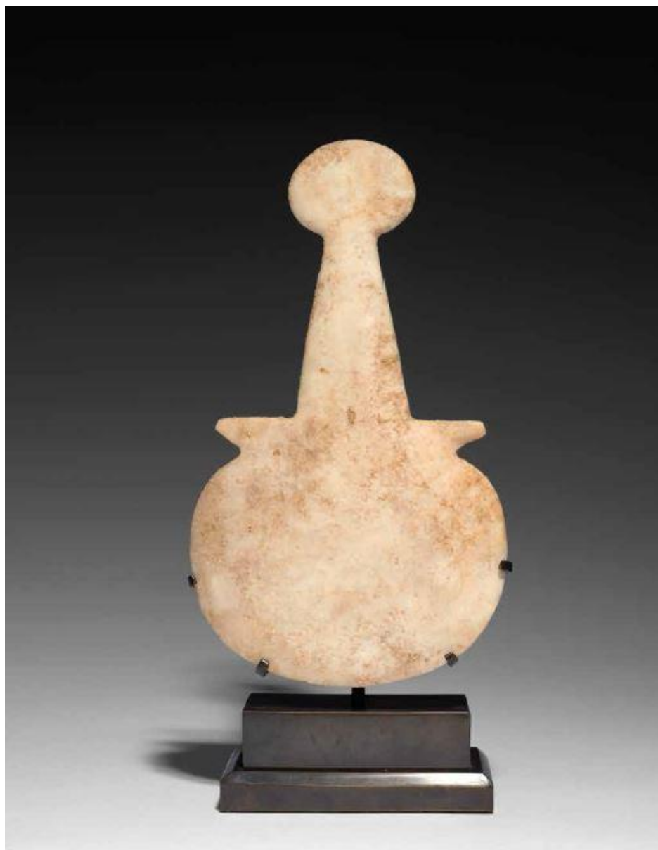
Grande idole en marbre blanc de type Kusura-Beycesultan, Anatolie, milieu du III e millénaire avant J.C., h. 25,4 cm (estimation : 80 000 - 100 000 € / 88 000 - 111 000 $)