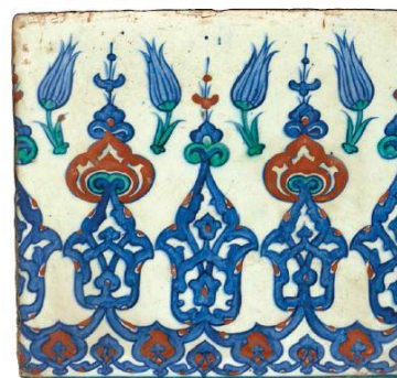
Carreau aux fleurons trilobés et tulipes, Iznik, art ottoman, vers 1570, céramique, estimation 10 000 - 12 000 € / 11 000 - 13 300 $

Ce rare buste en bronze représente un souverain sassanide, reconnaissable à sa couronne à créneaux surmontée d'un croissant et son collier perlé à pendentif au-dessus du apesac, attribut de sa dignité composé de deux bretelles croisées sur la poitrine et dans le dos. Conservé depuis les années 70 dans une collection privée britannique, cette sculpture est particulièrement recherchée car il subsiste très peu de ronde bosse de cette époque, la plupart ayant été fondus lors des invasions musulmanes. Les rares exemples connus sont aujourd'hui dans les collections de grands musées internationaux (Louvre, MET). Si le souverain ne peut être précisément identifié, c'est que ce type de représentation est avant tout une vision idéalisée personnalisant la fonction royale.