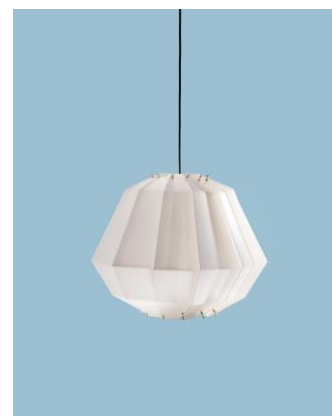
Gino Sarfatti, Suspension mod. 2083 , 1955, édition Arteluce, estimation : 10 000 - 12 000 € / 11 000 - 13 200 $