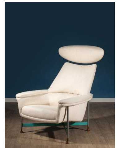
Finn Juhl, rare fauteuil à haut dossier , 1957, édition Niels Vodder, estimation : 50 000 - 70 000 € / 55 000 - 77 000 $