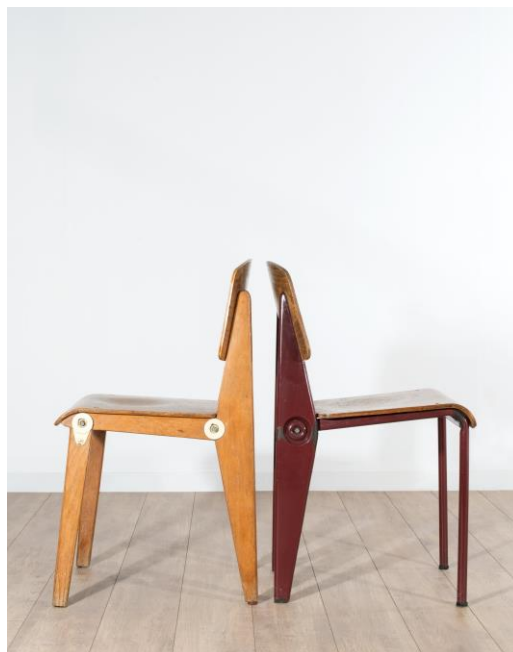
Jean Prouvé, chaises Standard démontables, en bois et acier, respectivement 10 000 – 15 000 € / 11 000 – 16 500 $ et 30 000 – 50 000 € / 33 000 – 55 000 $.

La vacance s'ouvrira sur la dispersion d'une importante collection privée parisienne, constituée autour des French Masters, avec une prédilection pour Jean Prouvé. Ce collectionneur précoce a fait l'acquisition d'une partie des pièces lors de la fameuse vente le Regard d'Alan , chez Binoche et Godeau en 1991. Elles n'ont jamais été vues sur le marché depuis. Pièce maîtresse de l'ensemble signé Jean Prouvé, un bureau Présidence , 1952, estimé : 200 000 – 300 000 € / 220 000 – 330 000 $. En mai 2015, Artcurial avait déjà vendu un bureau Présidence pour 111 780 € / 124 075 $, le deuxième prix le plus important pour une pièce de mobilier du designer aux enchères. La collection comporte également une suite de 4 chaises Standard (estimation : 16 000 – 20 000 € / 17 600 – 22 000 $), un fauteuil Anthony (estimation : 8 000 – 12 000 € / 8 800 – 13 200 $), une armoire à deux portes en aluminium (estimation : 30 000 – 40 000 € / 33 000 – 44 000 $), mais aussi une iconique bibliothèque Maison de la Tunisie de Charlotte Perriand (estimation : 90 000 – 120 000 € / 99 000 – 132 000 $).