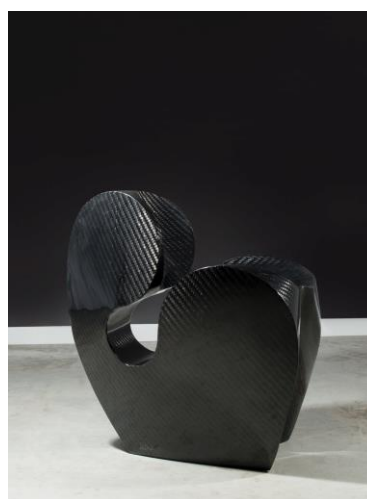
Ron Arad, fauteuil Carbon Little heavy , 2001, corps en fibre de carbone tissée, édition The Gallery Mourmans, estimation : 20 000 - 25 000 € / 22 000 - 27 500 $