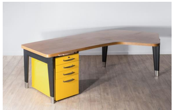
Jean Prouvé, Bureau dit Présidence , 1952, provenant d'une collection privée parisienne, estimation : 200 000 - 300 000 € / 220 000 - 330 000 $