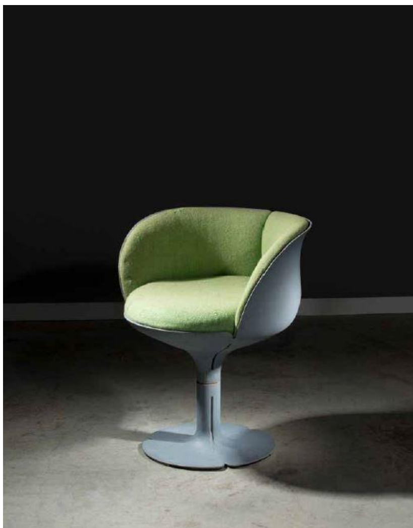
Pierre Paulin, rare fauteuil dit Elysée , 1973, estimation : 5 000 - 8 000 € / 5 500 - 8 800 $

Vente le 31 mai 2016 à 18h et 20h, à Paris