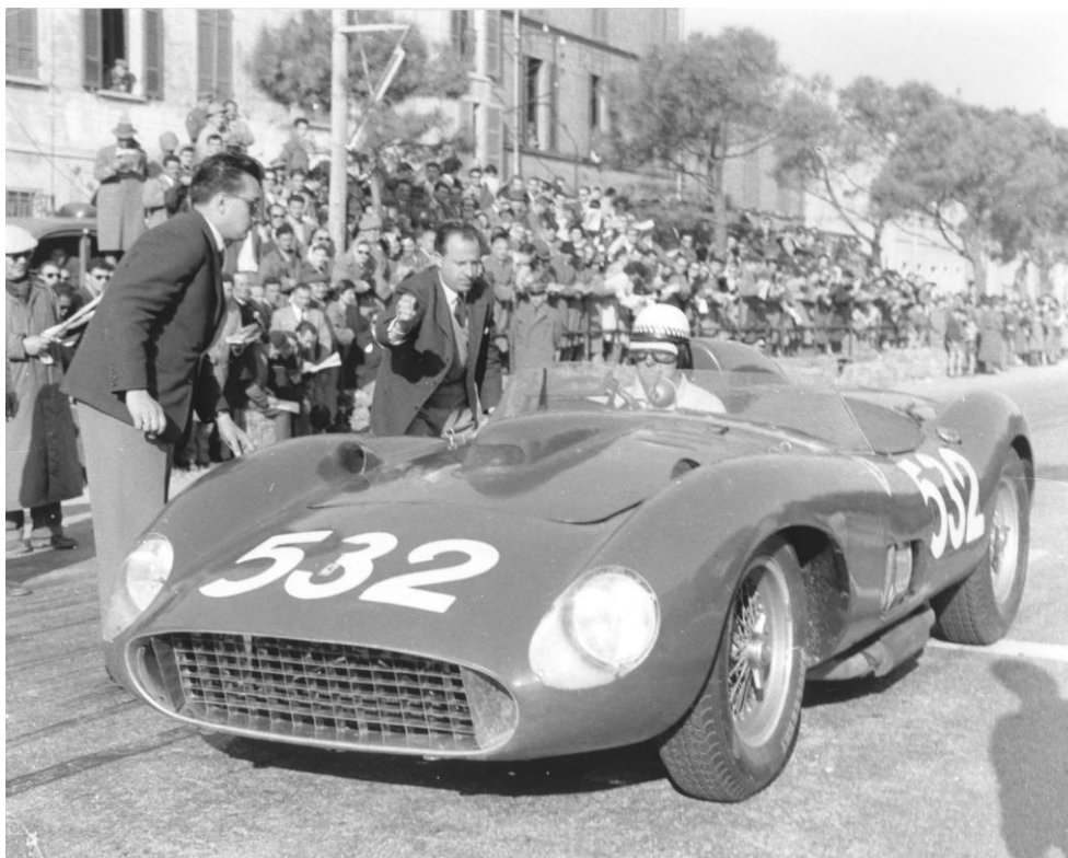
1957 Ferrari 335 S Scaglietti Spider, châssis 0674, estimation 28 - 32 M€ / 30 - 34 M$ Wolfgang von Trips, Mille Miglia 1957