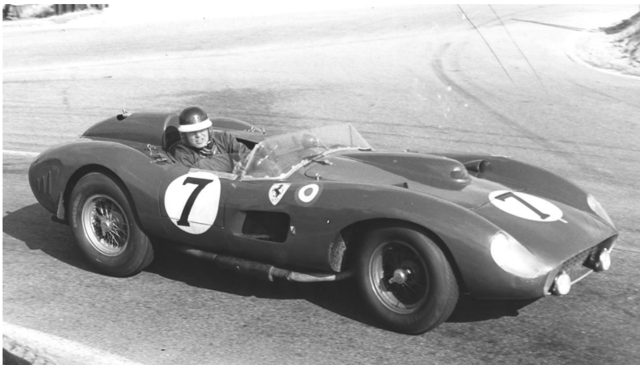
1957 Ferrari 335 S Spider Scaglietti, châssis 0674, estimation 28 - 32 M€ / 30 - 34 M$ Mike Hawthorn / Luigi Musso, 24 Heures du Mans 1957

Paris – Après la dispersion de la Collection Baillon et le record mondial de l'année pour une automobile, la Ferrari 250 California Spider (vendue 16,3 M€ / 18,5 M$), lors de la vente Rétromobile 2015, Artcurial Motorcars présente aux enchères pour l'édition 2016 de la vente officielle du salon Rétromobile, une des voitures les plus emblématiques de l'histoire du sport automobile : la Ferrari 335 S Spider Scaglietti de 1957, châssis 0674, provenant de la collection de Pierre Bardinon. Vente aux enchères volontaire avec la participation de Maître Philippe Dohr, CMA désigné en qualité de mandataire ad hoc. Elle est estimée 28 000 000 – 32 000 000 € / 30 000 000 – 34 000 000 $