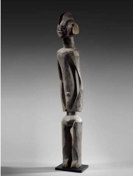
Statue d'ancêtre Mumuye, Nigeria

Estimation : 15 000 – 20 000 € / 16 500 – 22 000 $