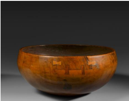
Bol, îles d'Hawaï