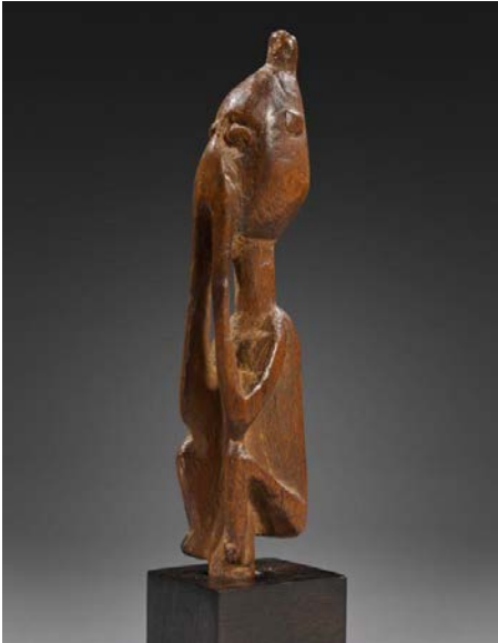
Statuette Dogon Kambari, Mali Estimation : 6 000 – 9 000 € / 6 600 – 9 900 $

Cette œuvre fait également partie de la collection de miniatures d'Andrée Appercelle. Elle combine l'équilibre entre les espaces vides et les espaces pleins, unifié par les bras dont les mains se joignent devant la bouche, tandis que les coudes sont pliés sur les genoux. Cette posture pourrait symboliser un moment de la cérémonie d'inauguration du prêtre « binu ».