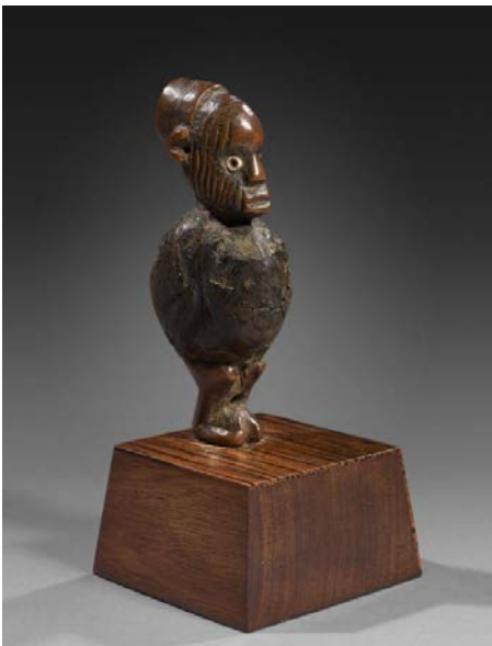
Statuette Teke, République Démocratique du Congo Estimation : 6 000 – 9 000 € / 6 600 – 9 900 $

Cette œuvre fait également partie de la collection de miniatures d'Andrée Appercelle. Elle combine l'équilibre entre les espaces vides et les espaces pleins, unifié par les bras dont les mains se joignent devant la bouche, tandis que les coudes sont pliés sur les genoux. Cette posture pourrait symboliser un moment de la cérémonie d'inauguration du prêtre « binu ».