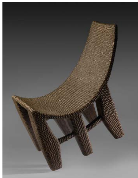
Trône royal Ngombe, République Démocratique du Congo

Provenant également du Pacifique, Artcurial proposera aux enchères un rare tabouret en bois de type « No'oanga », à l'assise rectangulaire légèrement cintrée, provenant de l'île d'Atiu, dans l'archipel des îles Cook (estimation : 30 000 – 50 000 € / 33 000 – 55 000 $).