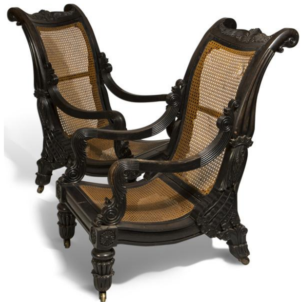
Lot 229 Paire de fauteuils en ébène Indue du Sud fin 19 ème siècle

Adjugé frais inclus 29 800 € / 322 138 Dh (est: 2 000 – 3 000 €)