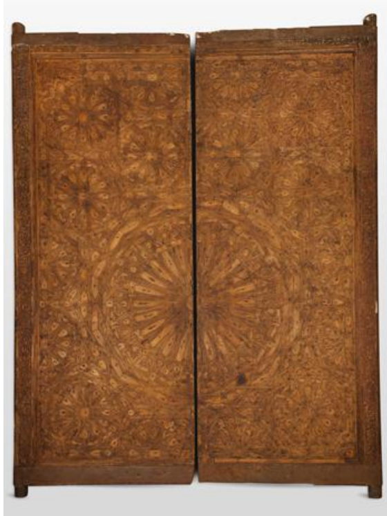
Lot 86 : Exceptionnelle porte de Mosquée ou de Medersa, Maroc, Marrakech, 17 – 18 ème siècle,

Adjugé frais inclus 93.000 € / 1.005.330 Dh (estimation : 20 000 – 30 000 €)