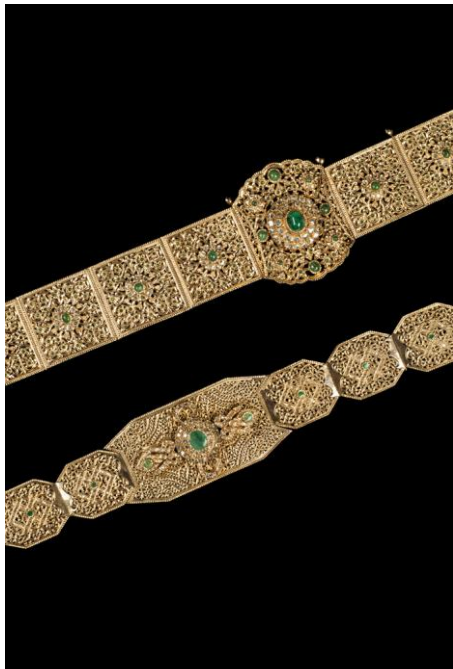
Lot 9 Ceinture de mariage, or et émeraudes Maroc Fès deuxième moitié du 20 ème siècle (en haut)

Adjugé frais inclus 14 300 € / 25 883 Dh (est: 3 000 – 4 000 €)