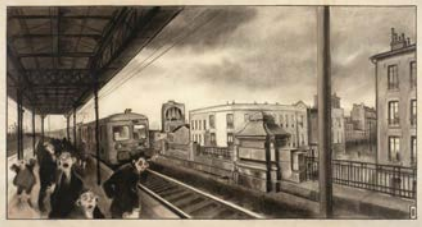
Lot 400 : TARDI, La gare de banlieue , fusain sur papier, 1990, adjudé frais inclus 125 800 € / 133 348 $ (Estimation 100 000 – 150 000 €).

RECORD DU MONDE POUR UNE ŒUVRE DE L'ARTISTE AUX ENCHERES