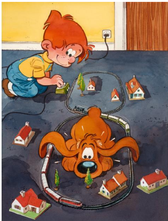
Lot 482 : Jean Roba, Les rails sur la moquette , Aquarelle et encre de Chine, adjudé frais inclus 75 800 € / 83 380 $ (estimation : 30 000 – 40 000 € / 33 000 – 44 000 $)

Enfin, le dessin de la couverture du 6e tome Le Chat du rabbin, tu n'auras pas d'autres dieux que moi , de Joann Sfar, qui paraîtra en septembre 2015 aux Editions Dargaud partait à 44 200 € / 48 620 $ (lot 497).