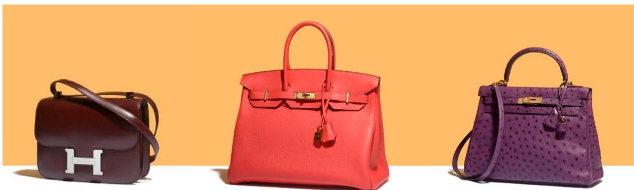
Sac Constance, Hermès Box Prune, Dim. : 15 x 23 cm. Estimation: 4 000 – 6 000 € / 4 500 – 6 700 $