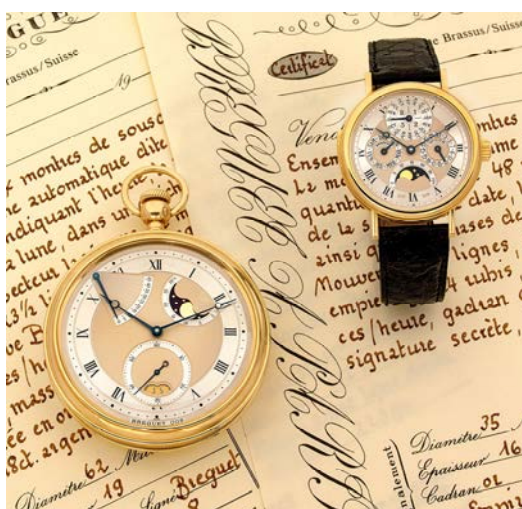
Ensemble de 2 montres de souscription, Breguet N° 8/300, vers 1991 Estimation 200 000 – 250 000 € / 220 000 – 280 000 $