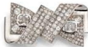
Double-clip Art Déco, Raymond Templier Platine et or gris, diamants Estimation : 40 000 – 50 000 € / 45 000 – 56 000 $