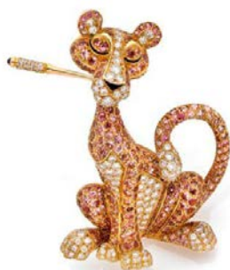
Broche Panthère rose Or jaune, saphirs roses et diamants Estimation: 3 000 – 4 000 € / 3 400 – 4 500 $