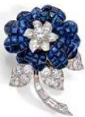
Broche Fleur de Pavot, Van Cleef & Arpels Platine et or gris, saphirs et diamants Estimation: 40 000 – 50 000 € / 45 000 – 56 000 $