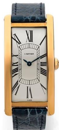
Montre Tank cintrée en or, Cartier N°027608/HSA1454, vers 1971 Estimation : 25 000 – 30 000 € / 28 500 – 34 000 $