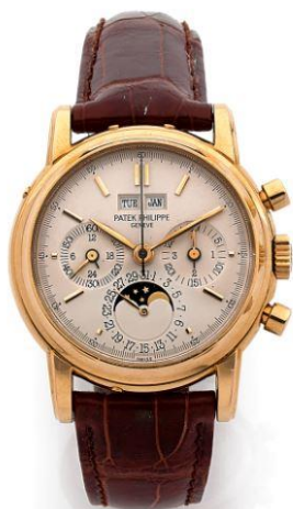
Montre Calendrier perpétuel, Patek Philippe Réf. 3970, N°2873886, vers 1991 Estimation: 55 000 – 80 000 € / 51 000 – 91 000 $