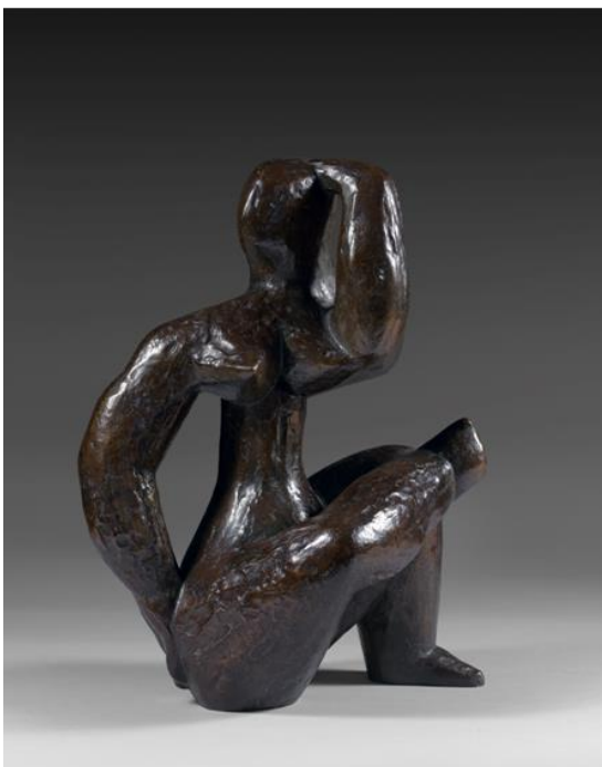
Henri Laurens Petite femme assise, 1932 Bronze à patine brune Estimation : 150 000 – 200 000 € / 165 000 – 220 000 $