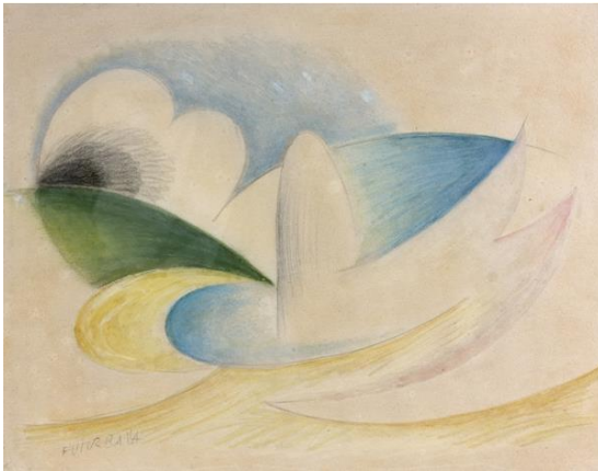
Giacomo Balla Ritmo di fontana, 1918 Pastel sur papier Estimation : 150 000 – 200 000 € / 165 000 – 220 000 $