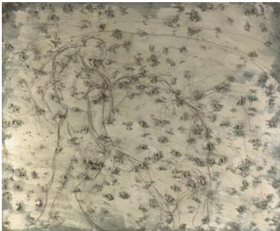
Miquel Barcelo, Izquierdazo , 2004, huile sur toile et fusain (estimation : 250 000 - 350 000 € / 270 000 – 380 000 $).

Les 120 œuvres réunies pour la vente Post-War & Contemporain du lundi 1 er juin 2015, illustreront les grands mouvements artistiques de la seconde moitié du XX e siècle avec des œuvres appartenant à la Figuration Narrative, mais aussi l'Art Conceptuel avec Sol LeWitt et Donald Judd, et un ensemble d'Affichistes français dont Jacques Villeglé. Enfin, provenant de la même collection, Artcurial proposera deux œuvres de Manolo Millares et Miquel Barcelo.