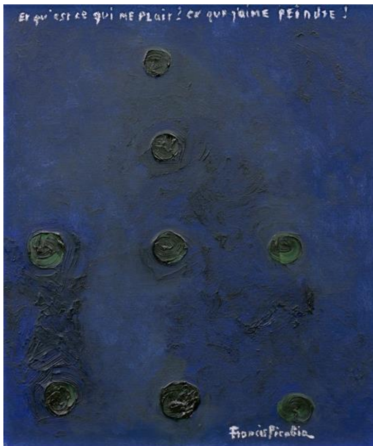
Francis Picabia, Points , 1951, huile sur toile (estimation : 120 000 - 180 000 € / 130 000 - 195 000 $).

Paris – Artcurial donne rendez-vous aux collectionneurs et amateurs d'art lors de ses grandes ventes Impressionniste & Moderne, et Post-War & Contemporain de juin 2015. Au cours de deux vacations, ce sont près de 240 œuvres qui seront proposées aux enchères, offrant un vaste panorama de la création internationale. L'huile sur toile de Francis Picabia, Points , peinte en 1951 (estimation : 120 000 – 180 000 € / 130 000 – 195 000 $), fera le lien entre ces deux vacations en soirée.