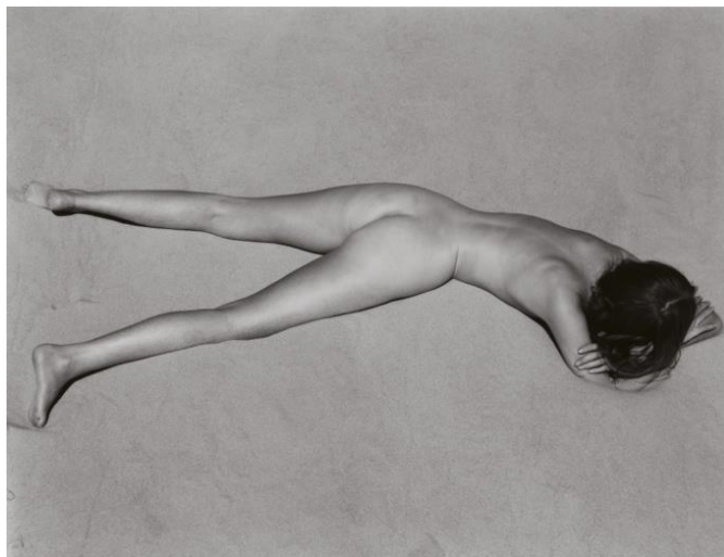
Edward Weston, Nude , 1936, collection Amedeo M. Turello (estimation : 6 000 – 8 000 € / 6 700 – 8 900 $)