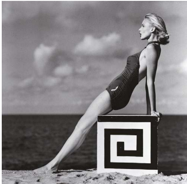
F.C. Gundlach, Christa Vogel, 1958 , collection Amedeo M. Turello (estimation : 3 000 – 4 000 € / 3 350 – 4 500 $)