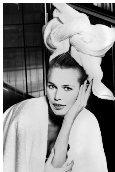
Karl Lagerfeld, Claudia Schiffer at the Thermes Marins – Monte Carlo , 1995, collection Amedeo M. Turello (estimation : 1 000 – 1 500 € / 1 100 – 1 650 $)

Paris – A l'occasion de la FIAC, Artcurial dispersera la collection de photographies d'Amedeo M. Turello. L'ensemble d'œuvres qu'il a réuni reflète ses goûts artistiques tout en étant autant de témoignage des rencontres qu'il a pu faire dans sa carrière de photographe de mode professionnel. Au gré des collaborations, il a été amené à cotoyer les plus célèbres photographes du XXe siècle. Certains sont devenus des amis. Ce sont ces clichés qu'il vend aujourd'hui. Une partie de sa collection a été exposé à plusieurs reprises en particulier en 2013 dans le cadre de l'événement « Nice 2013, un été pour Matisse ». A cette occasion, Jean-Jacques Aillagon, commissaire artistique de la manifestation, expliquait « De son expérience de photographe de mode, Amedeo a acquis le goût de la photographie, cet art relativement récent qui n'a pas encore fêté son deux centième anniversaire. »