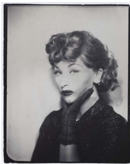
Cindy Sherman, untitled (Lucie Ball) , 1975, collection Amedeo M. Turello (estimation 6 000 – 8 000 € / 6 700 – 8 900 $)