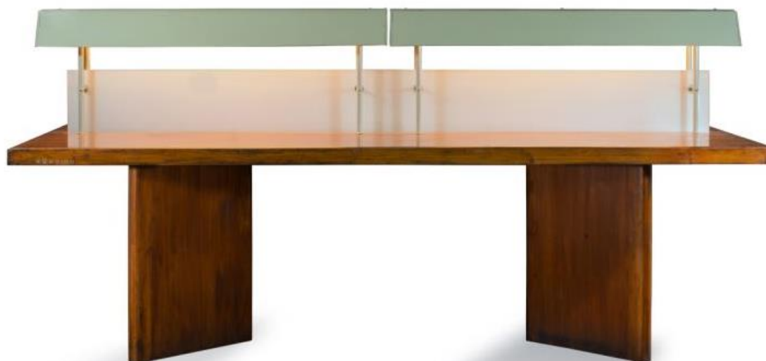
Pierre Jeanneret, Table de lecture éclairante, vers 1963/1964, teck, acier et verre dépoli, Provenance : Bibliothèque de l'Université du Penjab, Chandigarh, Estimation : 120 000 – 150 000 € / 132 000 – 165 000 $