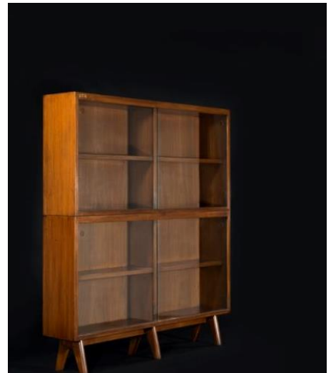
Pierre Jeanneret, Vitrine-bibliothèque double, vers 1960, teck et verre, provenance : Chandigarh, estimation : 6 000 - 8 000 € / 6 600 - 9 900 $