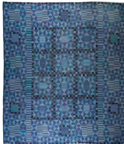
Marianne Richter, Tapis Rubirosa bleu , 1958, laine, estimation : 40 000 – 60 000 € / 44 000 – 66 000 $