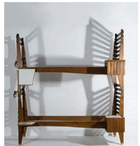
Carlo Mollino, lit dit Casa del Sole , 1953, chêne, estimation : 8 000 - 12 000 € / 8 800 - 13 200 $