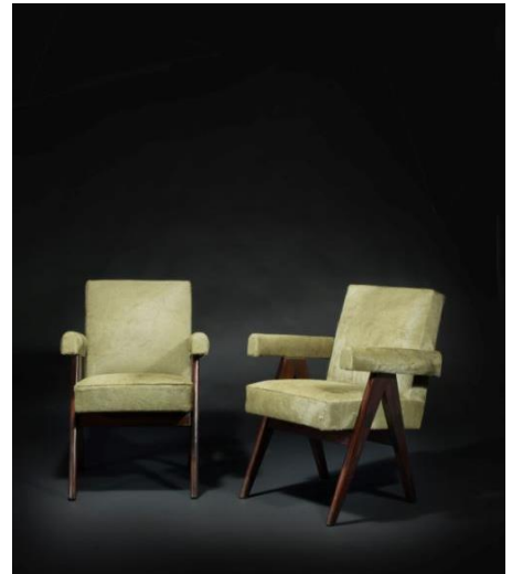
Pierre Jeanneret, paire de fauteuil dits "Comittee Chair", vers 1953/54, teck et poulain vert, provenance : Assemblée, Chandigarh, estimation : 20 000 - 30 000 € / 22 000 - 33 000 $