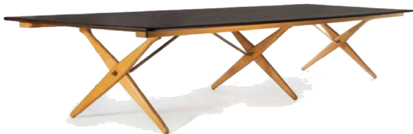
Hans J. Wegner, Table, 1987, frêne et palissandre, pièce unique, estimation : 150 000 – 200 000 € / 165 000 – 220 000 $

Dernière étape de ce voyage en Scandinavie, Copenhague, l'historique bar du SAS Royal Hotel. Le prestigieux établissement cinq étoiles a été entièrement conçu et designé par Arne Jacobsen entre 1956 et 1960. Parmi les meubles qu'il dessinera pour le palace, plusieurs deviendront des classiques du Design, comme les tabourets bar en cuivre recouvert de cuir. Artcurial en proposera 4 exemplaires à la vente (estimation 20 000 – 30 000 € / 22 000 – 33 000 $).