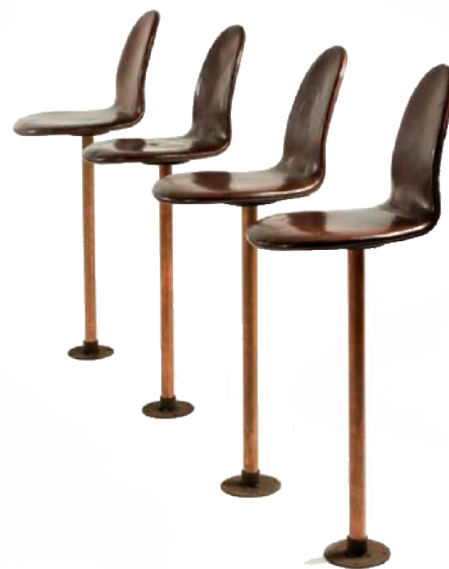
Arne Jacobsen, 4 tabourets de bar, 1960, SAS Royal Hotel de Copenhague, estimation : 20 000 – 30 000 € / 22 000 – 33 000 $