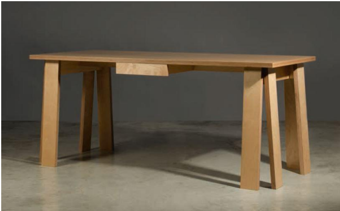
Martin Szekely, bureau Satragno , 1994, bouleau, estimation : 5 000 – 7 000 € / 5 500 – 7 700 $