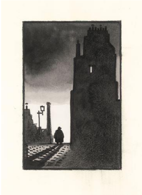
Tardi, Voyage au bout de la nuit , encre de Chine et crayon gras pour le dessin de couverture de ce livre publié en 1998 aux éditions Futuropolis (estimation : 6 000 – 8 000 € / 6 800 – 9 000 $)