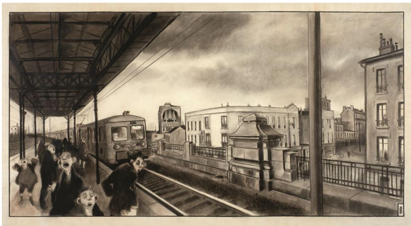
Tardi, La gare de banlieue , fusain sur papier (estimation : 100 000 – 150 000 € / 113 650 – 170 500 $)

- EXPOSITION DU 29 OCTOBRE AU 4 NOVEMBRE, VENTE LE 21 NOVEMBRE 2015 -