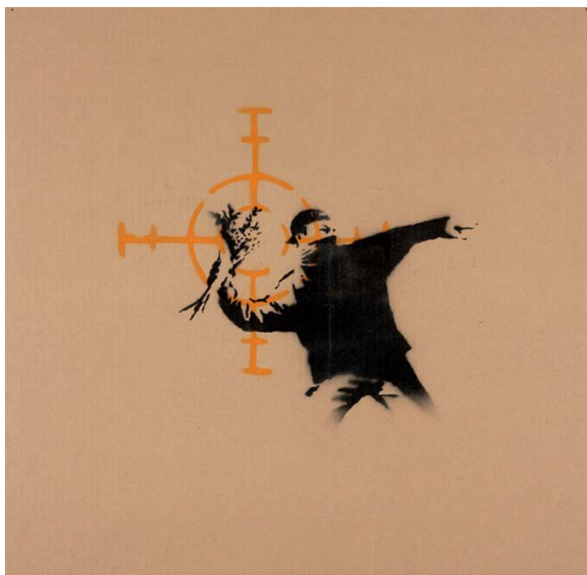
Love in the air , 2003, BANKSY, pochoir et peinture aérosol sur carton (estimation : 80 000 – 120 000 € / 88 000 – 132 000 $)

Paris – Le 27 octobre 2015, à 20h, Artcurial proposera pour la première fois une vente Urban Art pendant la FIAC. Cette nouvelle vacation annuelle a pour vocation de présenter, alors que les principaux collectionneurs d'art contemporain français et internationaux sont à Paris, une sélection d'œuvres encore peu représentées à la FIAC. Intitulée The Beautiful Winners , elle fait suite au succès de la vente Urban Art du 4 février dernier qui avait totalisé près de 2 M€ / 2,25 M$ (+ 40 % par rapport à 2014), avec 86 % de lots vendus et des records aux enchères pour plusieurs artistes.