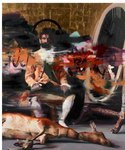
The Killer inside me , 2012, CONOR HARRINGTON, huile, peinture aérosol et feuilles d'or (estimation : 40 000 – 60 000 € / 45 000 – 67 500 $)

Faisant écho au travail de l'anglais, on trouvera plusieurs œuvres de DRAN, le « Banksy français », dont une œuvre de 2010, Security (estimation : 8 000 – 12 000 € / 8 800 – 13 250 $). Ses critiques de la société contemporaine sont parsemées de touches d'humour et de cynisme.