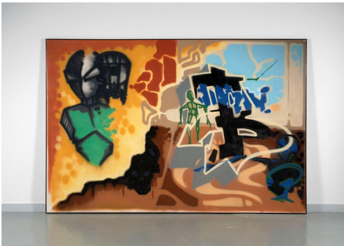
Bishop of Battle , 1985, DONDI WHITE, peinture aérosol sur toile (estimation : 40 000 – 60 000 € / 45 000 – 67 500 $)

A l'époque Beautiful Losers , ces artistes deviennent Beautiful Winners . Artcurial, pionnière des ventes de graffiti et d'art urbain contemporain, les sacre en leur offrant une exposition pendant la FIAC. Collectionneurs et amateurs découvriront à cette occasion la richesse de la culture de l'Urban art avec ses nombreuses références à la bande dessinée, aux Super Héros des Comics, aux séries télévisées, au punk-rock, au skateboard. Plusieurs grands courants seront représentés.