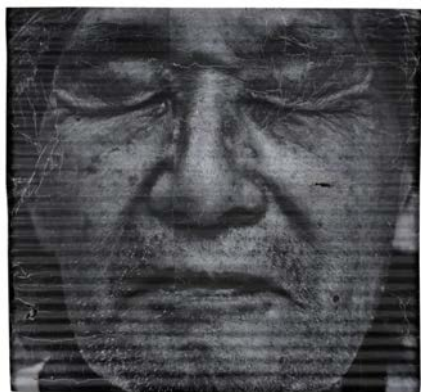
Wrinkles of city - Shanghai - China - « Gi Ginsui » , JR, 2010, tirage photographique sur tôle ondulée (estimation : 35 000 – 45 000 € / 40 000 – 50 500 $)

CONOR HARRINGTON fait partie de ces artistes qui ont gagné la reconnaissance internationale dans la rue avant de s'attaquer à d'autres supports plus institutionnels. L'irlandais, installé à Londres, crée des œuvres dynamiques, parfois empreintes de violence. On reconnaît son style entre le réalisme de la peinture classique et les codes street, magnifié par une touche vibrante. Artcurial présentera, le 27 octobre, une huile The Killer inside me (40 000 – 60 000 € / 45 000 – 67 500 $). En février dernier, Artcurial vendait pour 72 500 € / 87 787 $ frais inclus, Tardis of the light , 2012. Le quadruple de son estimation !