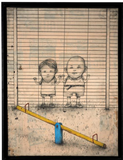
Security , 2010, DRAN, gouache et crayon à la pierre noire sur papier marouflé sur toile (estimation : 8 000 – 12 000 € / 8 800 – 13 250 $)