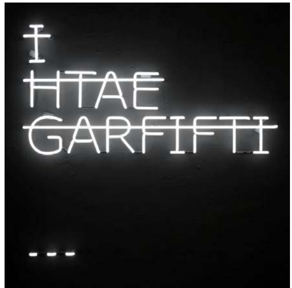
Sans titre (I htae garfifti) , 2012, RERO, technique mixte et néon sur panneau en bois (estimation : 8 000 – 12 000 € / 8 900 – 13 250 $)