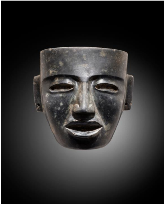
Masque funéraire, culture de Teotihuacán, Période classique 250 - 650 AP. J-C Estimation: 200 000 - 250 000€ / 213 000 – 266 000 $