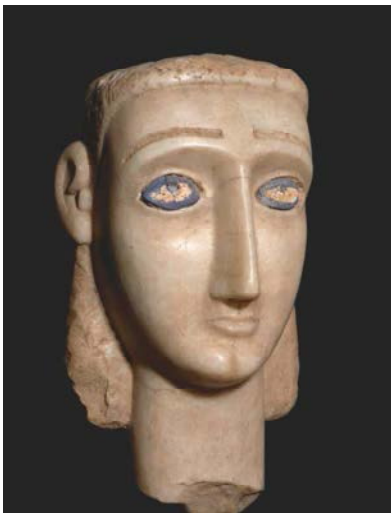
Tête féminine en albâtre, Yémen sud-arabique, fin du 1er millénaire AV. J.C. Estimation 20 000 - 30 000 € / 21 000 - 32 000 $

La gueule est ouverte, la langue pendante et le cou ceinturé d'un collier sauvagement méché son pelage est finement ciselés et son corps est patiné vert, rouge et noir.