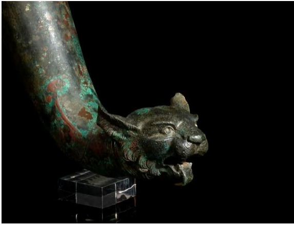
Rhyton en bronze à tête de félin, Art Parthe, 1er siècle AV. J.C. - 1er siècle AP. J.C. Estimation : 110 000 - 130 000€ / 117 000 – 138 000 $